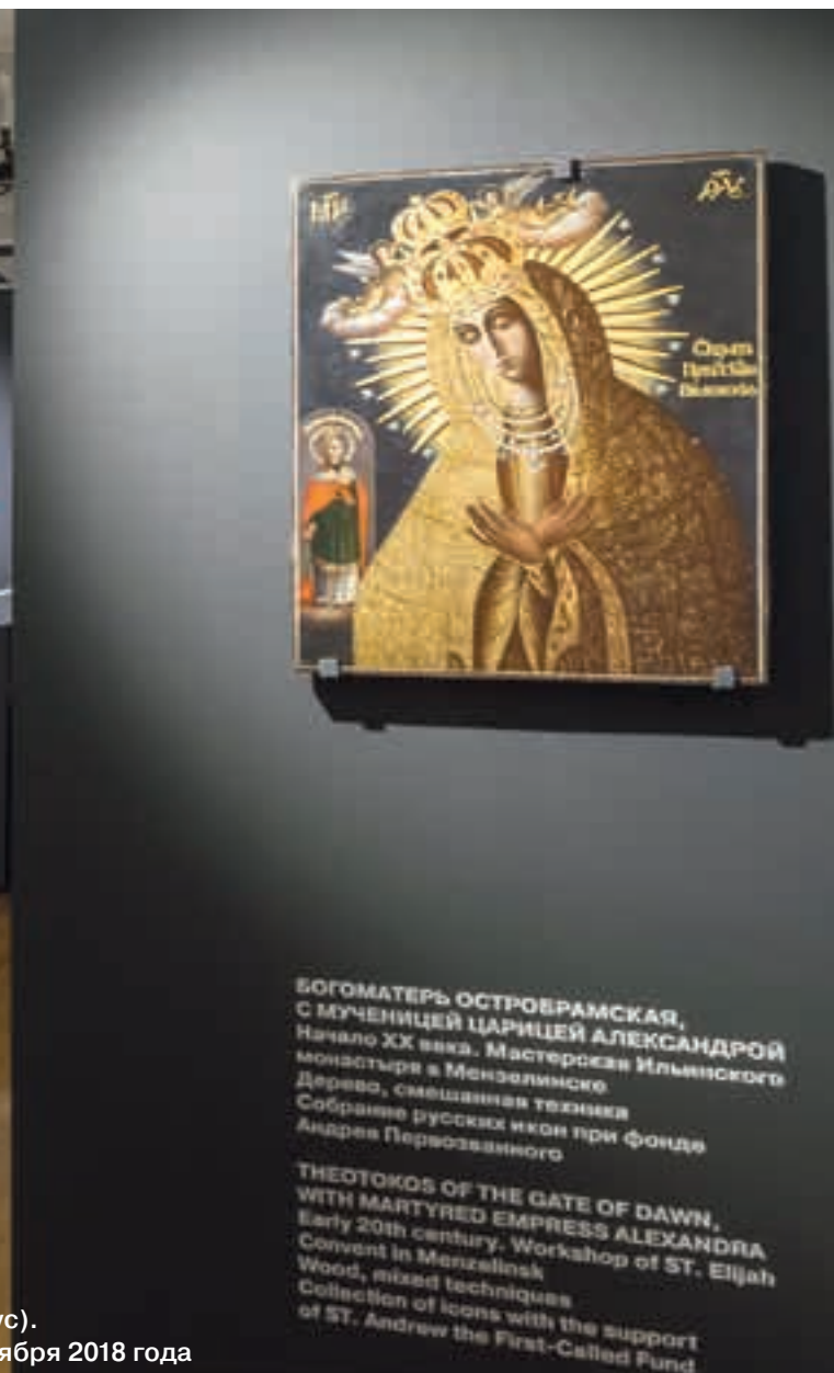
Зал периодических выставок (Настоятельский корпус). Выставка «Иконы эпохи Николая II». 18 июля – 23 октября 2018 года

БОГОМАТЕРЬ ОСТРОВБРАМСКАЯ, С МУЧЕНИЦЕЙ ЦАРИЦЕЙ АЛЕКСАНДРОЙ Начало XX века. Мастерская Ильинского монастыря в Мензелинске Дерево, смешанная техника Собрание русских икон при фонде Андрея Первозванного THEOTOKOS OF THE GATE OF DAWN, WITH MARTYRED EMPRESS ALEXANDRA Early 20th century. Workshop of St. Elijah Convent in Menzelinsk Wood, mixed techniques Collection of icons with the support of St. Andrew the First-Called Fund