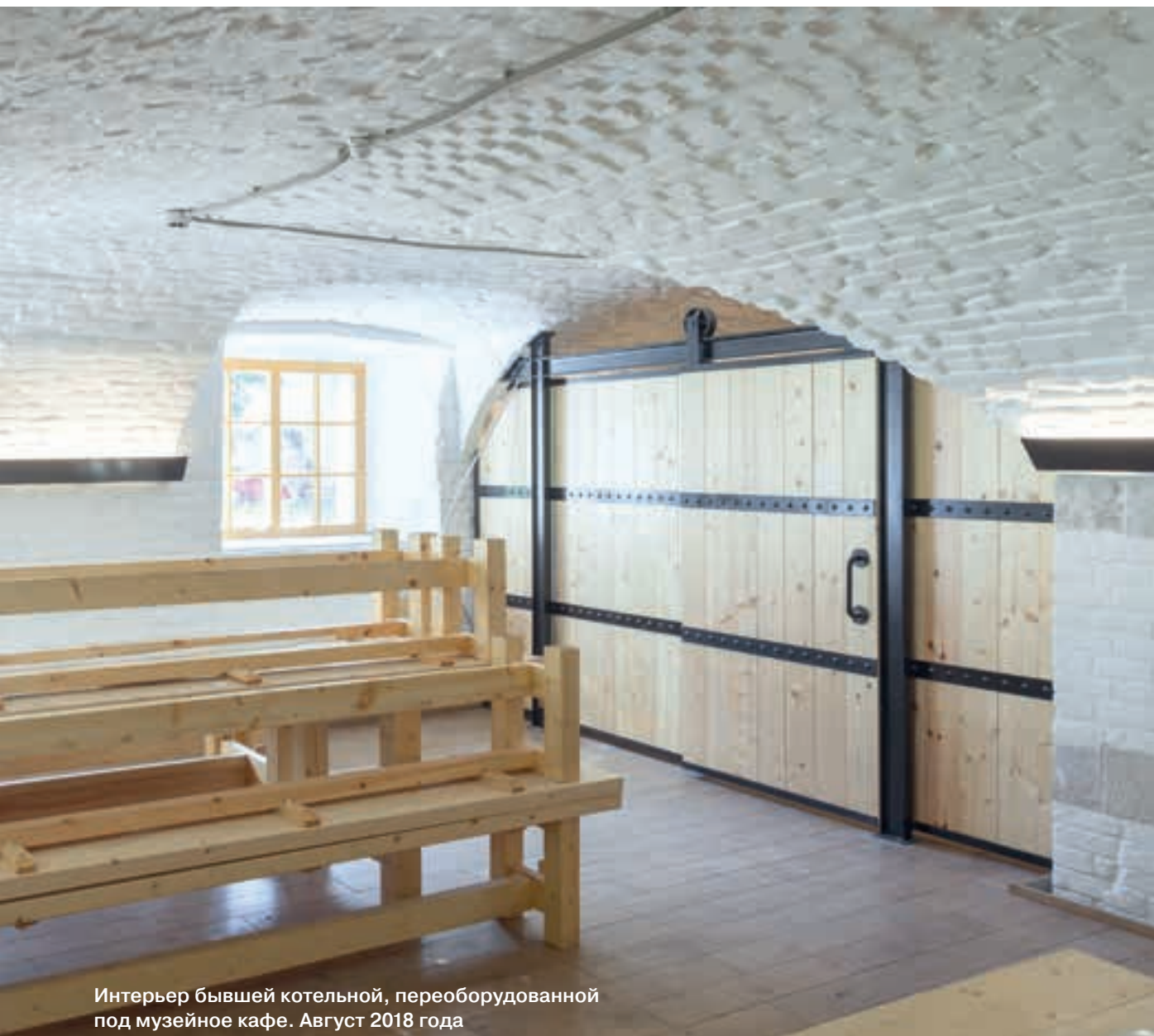
Интерьер бывшей котельной, переоборудованной под музейное кафе. Август 2018 года