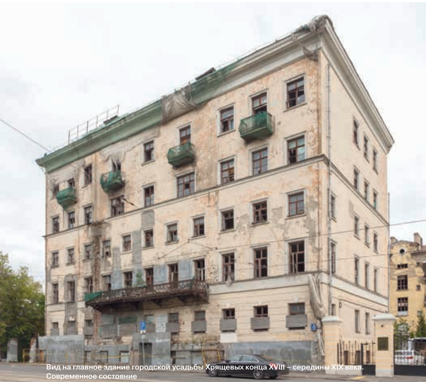
Вид на главное здание городской усадьбы Хрящевых конца XVIII – середины XIX века. Современное состояние