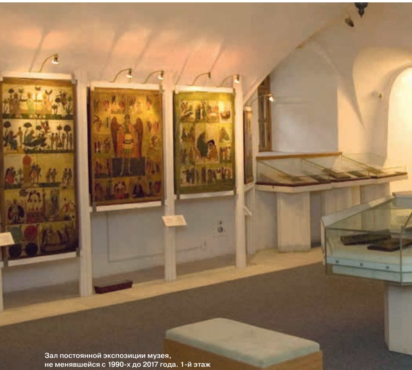
Зал постоянной экспозиции музея, не менявшейся с 1990-х до 2017 года. 1-й этаж