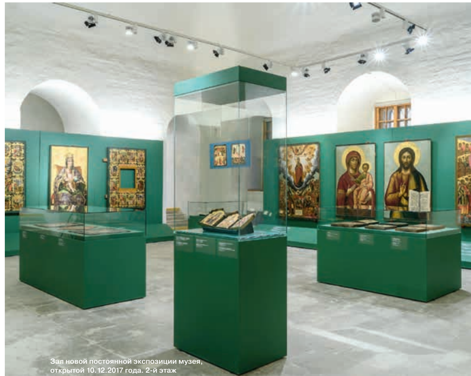
Зал новой постоянной экспозиции музея, открытой 10.12.2017 года. 2-й этаж