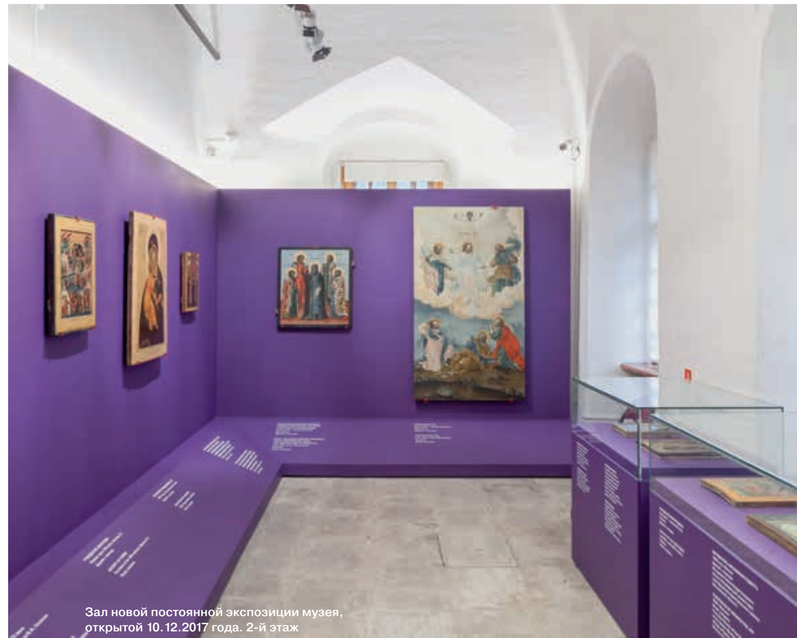
Зал новой постоянной экспозиции музея, открытой 10.12.2017 года. 2-й этаж