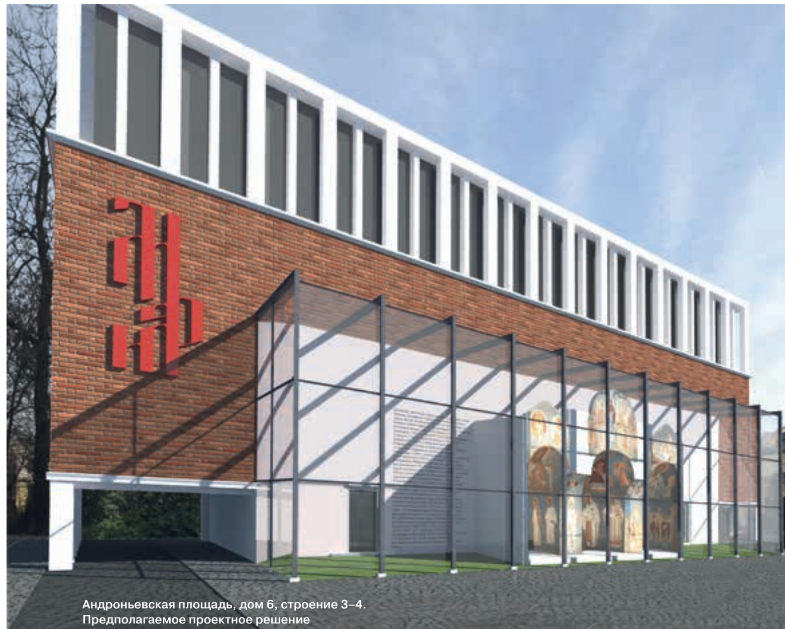
Андроньевская площадь, дом 6, строение 3-4. Предполагаемое проектное решение