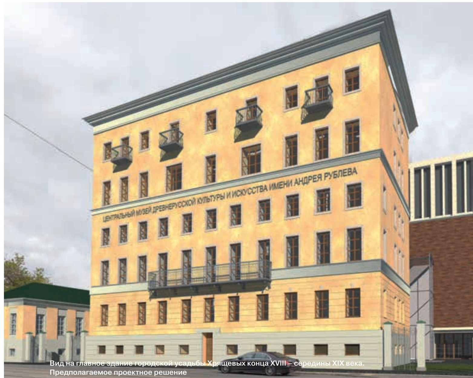
Вид на главное здание городской усадьбы Хрящевых конца XVIII – середины XIX века. Предполагаемое проектное решение