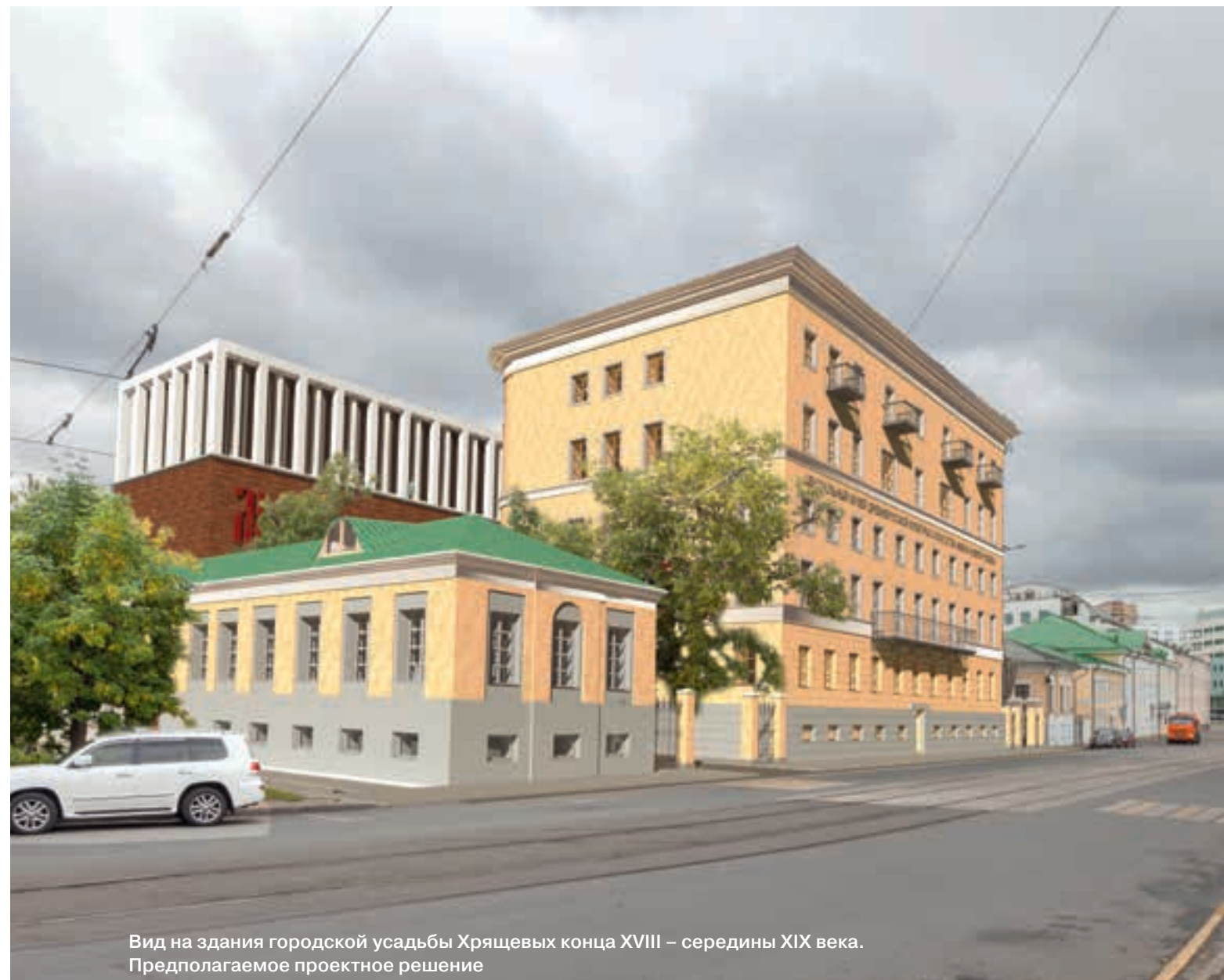
Вид на здания городской усадьбы Хрящевых конца XVIII – середины XIX века. Предполагаемое проектное решение