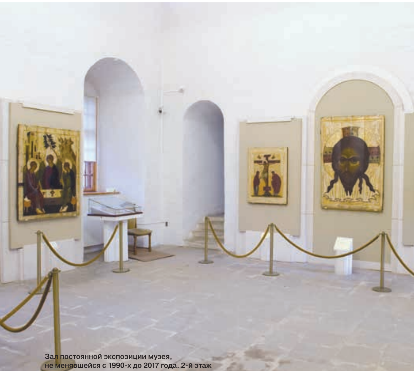
Зал постоянной экспозиции музея, не менявшейся с 1990-х до 2017 года. 2-й этаж