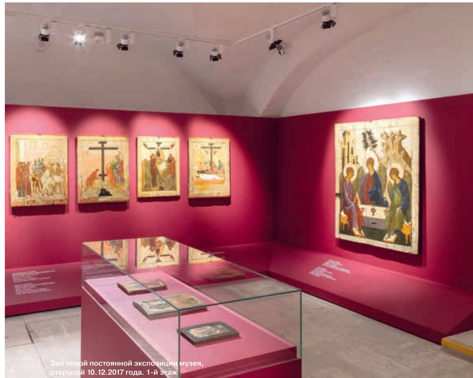
Зал новой постоянной экспозиции музея, открытой 10.12.2017 года. 1-й этаж