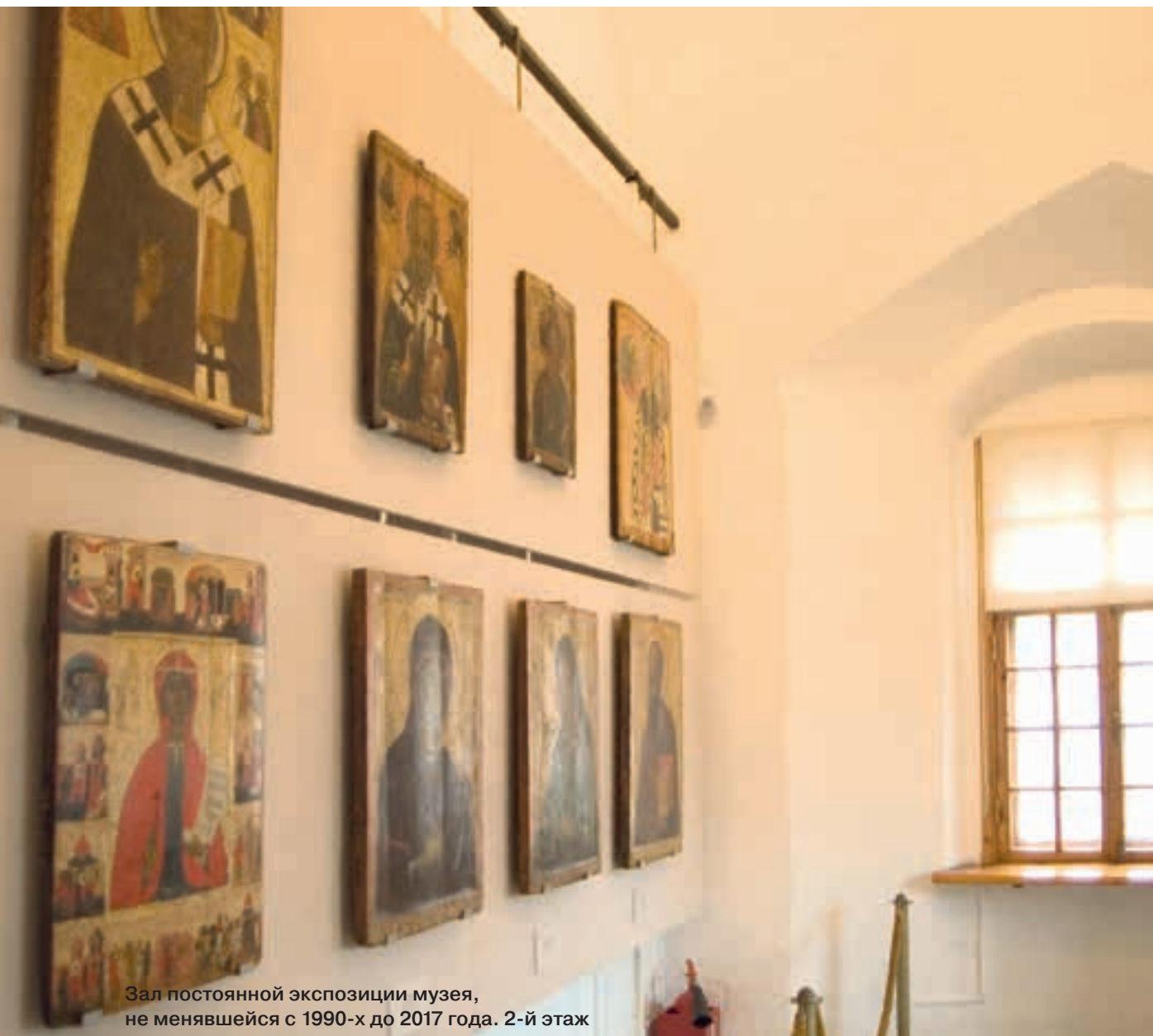
Зал постоянной экспозиции музея, не менявшейся с 1990-х до 2017 года. 2-й этаж