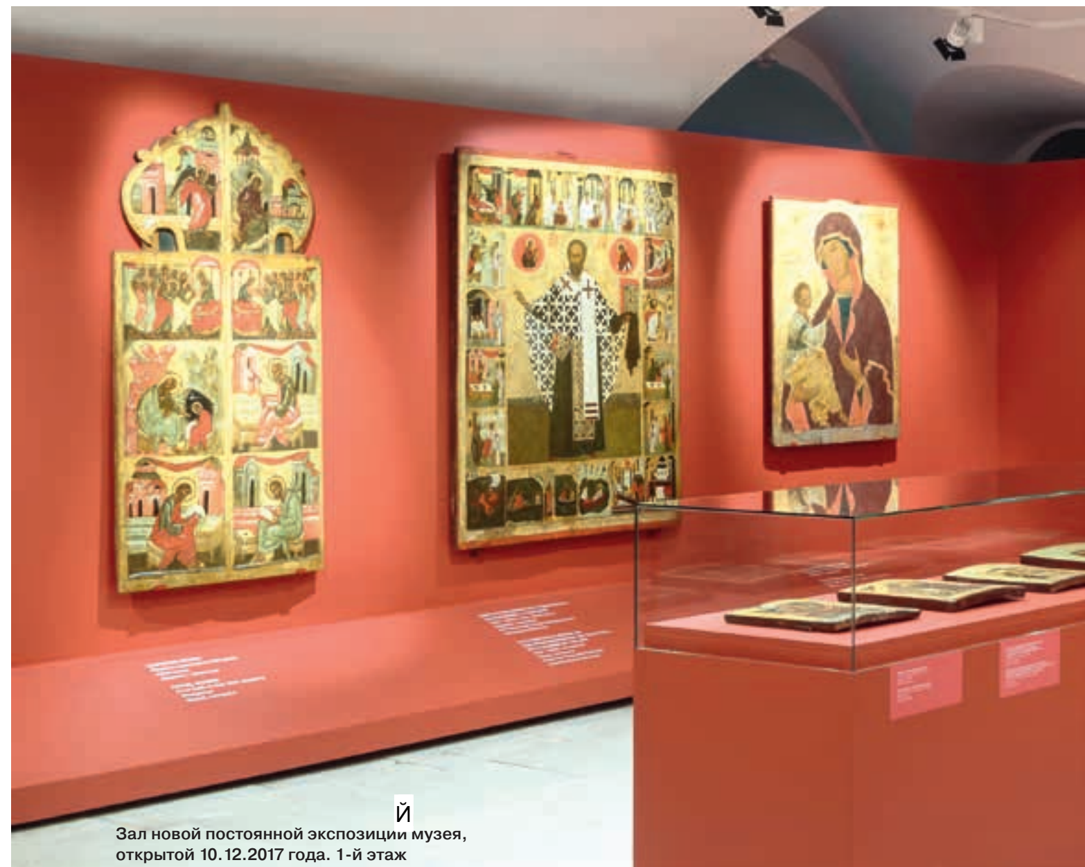
Й Зал новой постоянной экспозиции музея, открытой 10.12.2017 года. 1-й этаж