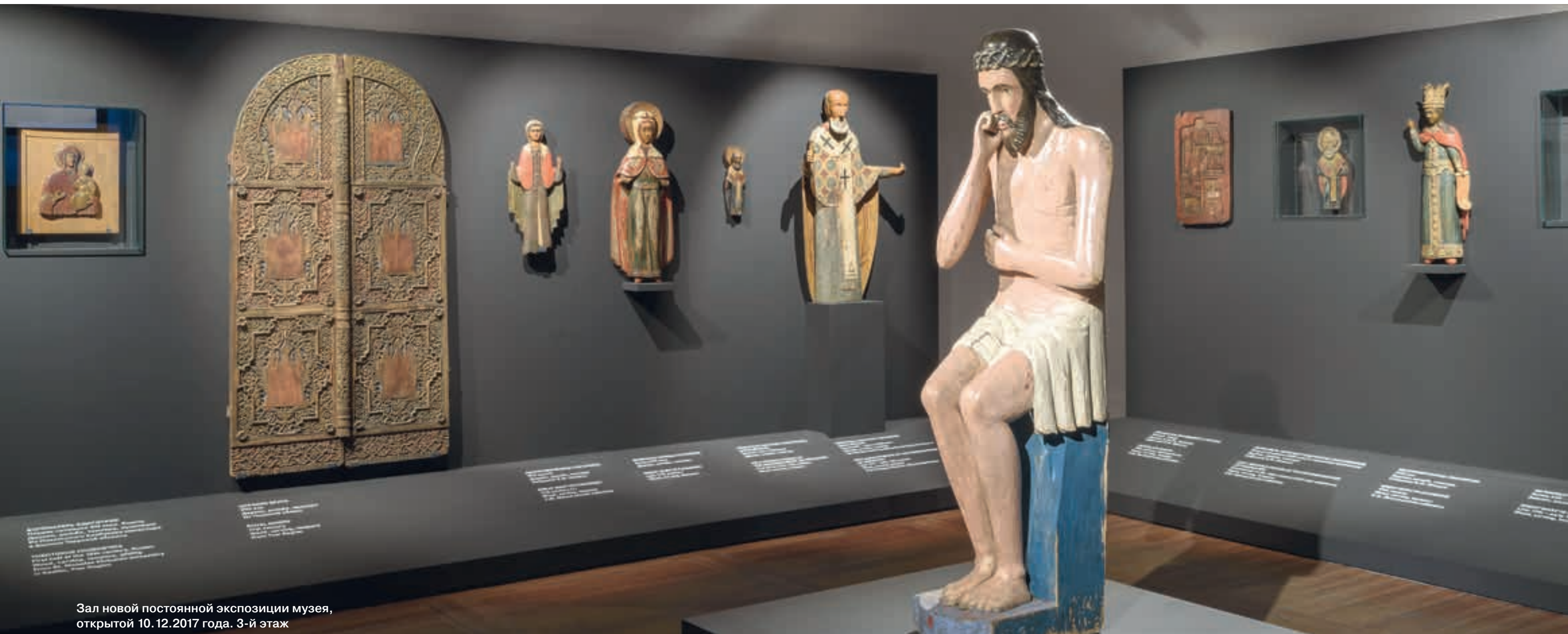
Зал новой постоянной экспозиции музея, открытой 10.12.2017 года. 3-й этаж