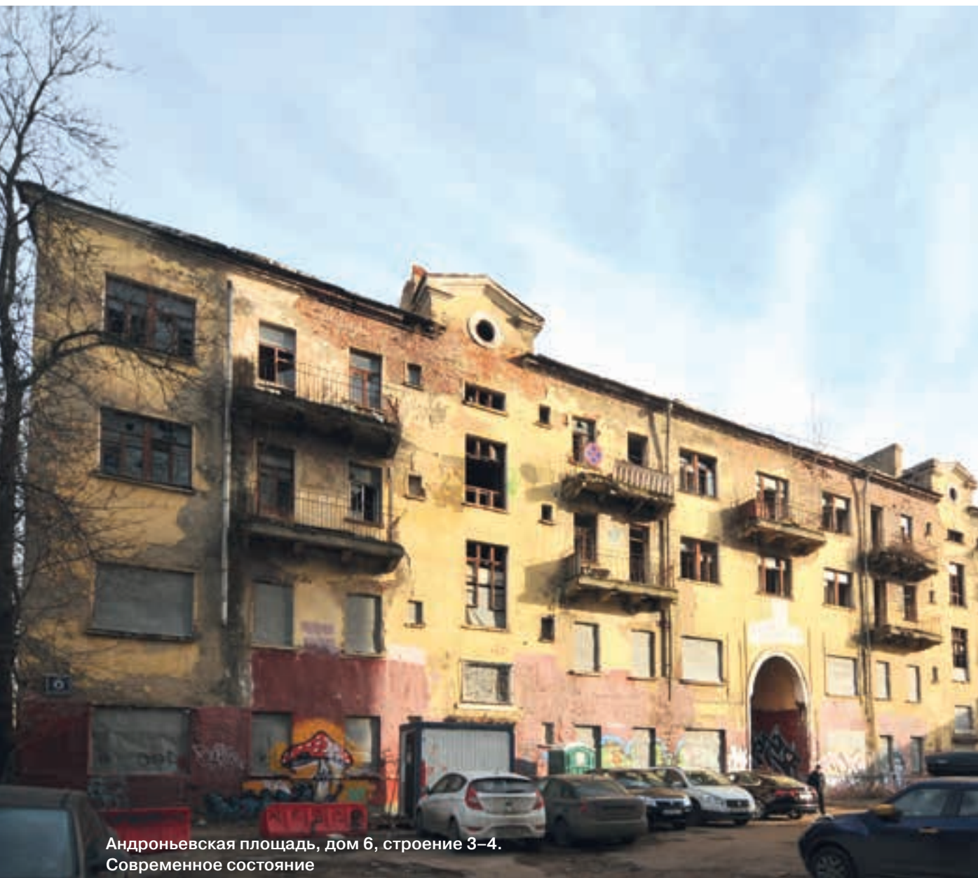
Андроньевская площадь, дом 6, строение 3-4. Современное состояние