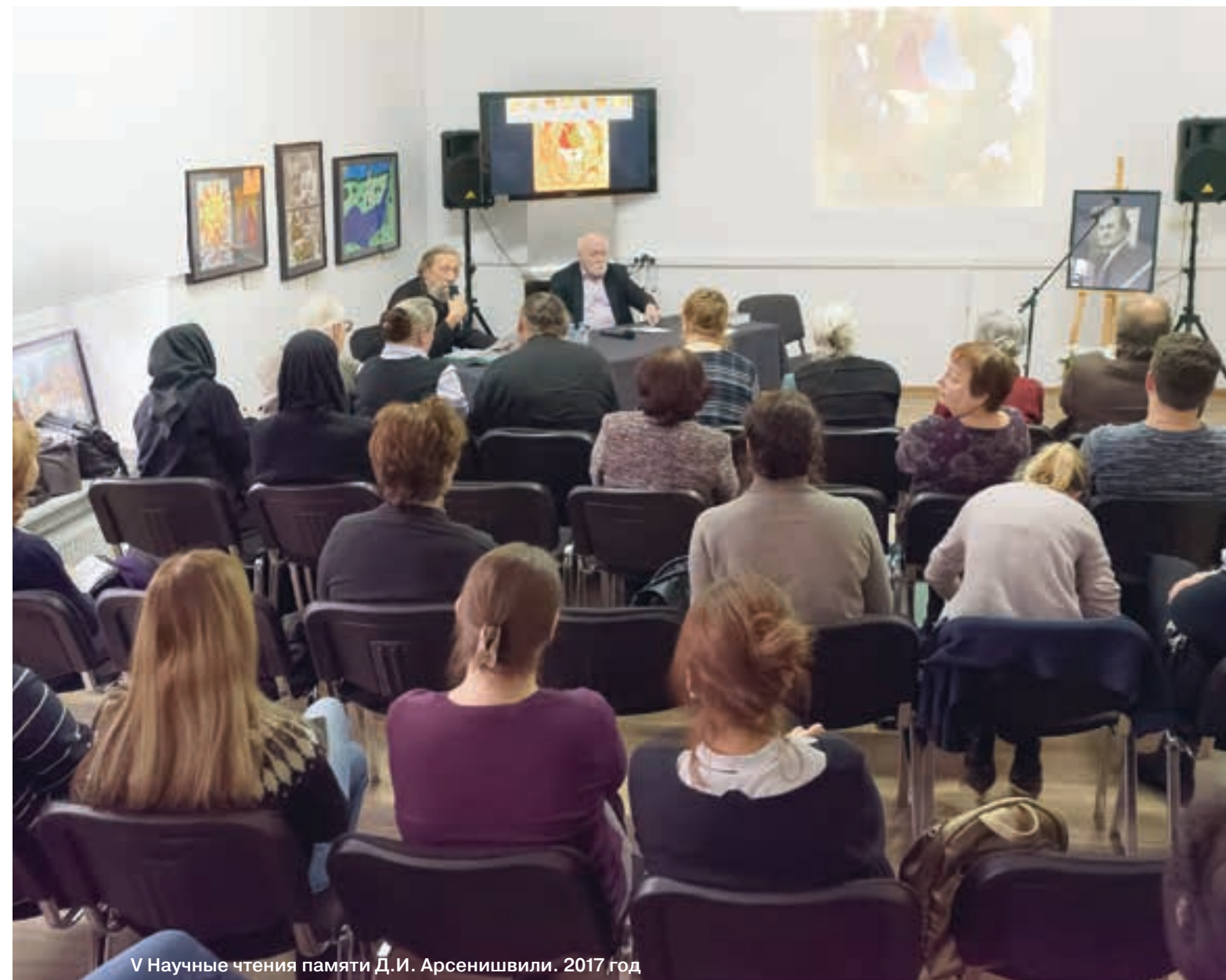
V Научные чтения памяти Д.И. Арсенишвили. 2017 год