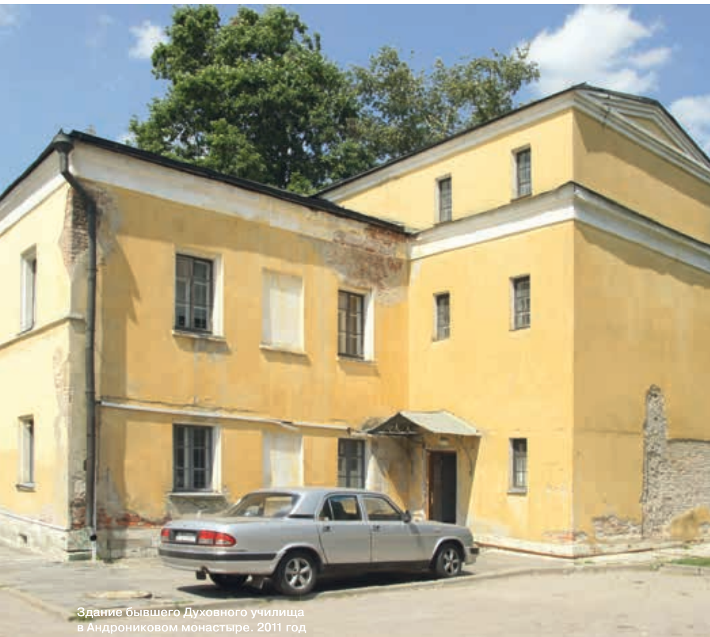
Здание бывшего Духовного училища в Андрониковом монастыре. 2011 год