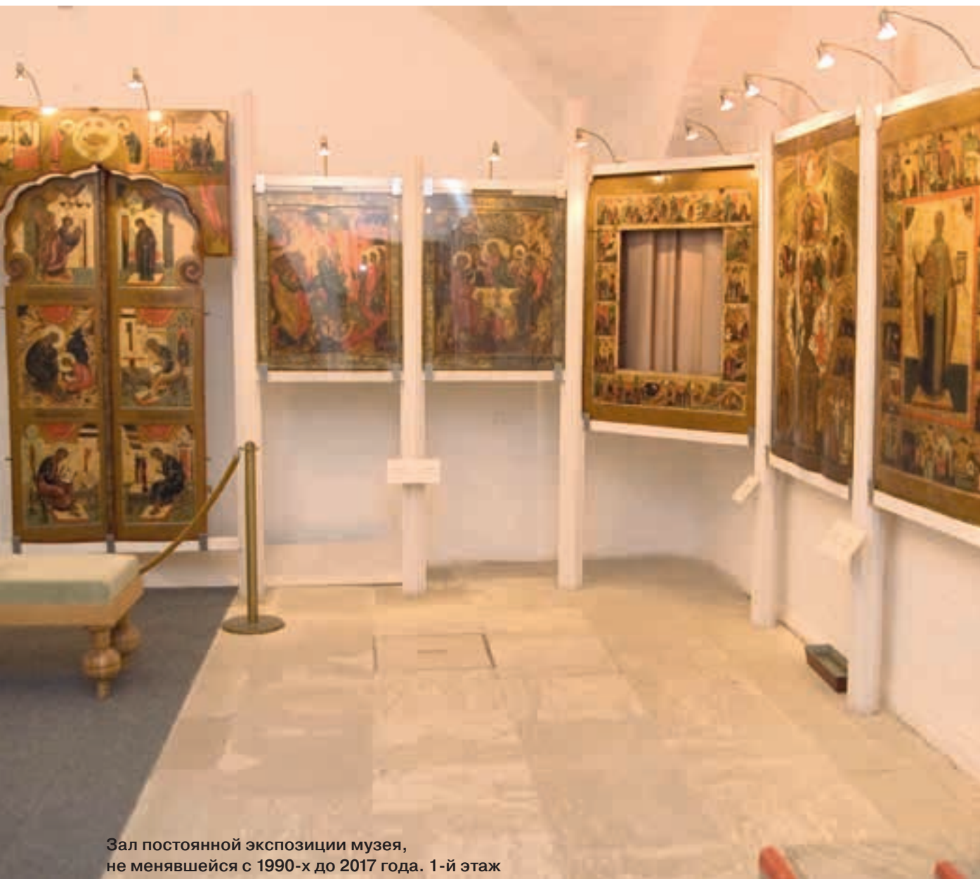
Зал постоянной экспозиции музея, не менявшейся с 1990-х до 2017 года. 1-й этаж