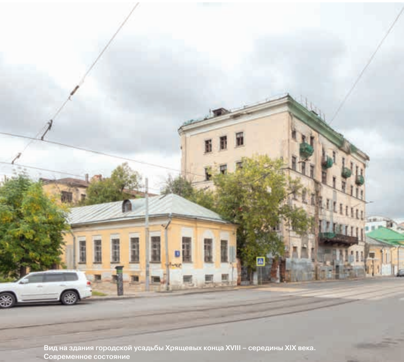
Вид на здания городской усадьбы Хрящевых конца XVIII – середины XIX века. Современное состояние