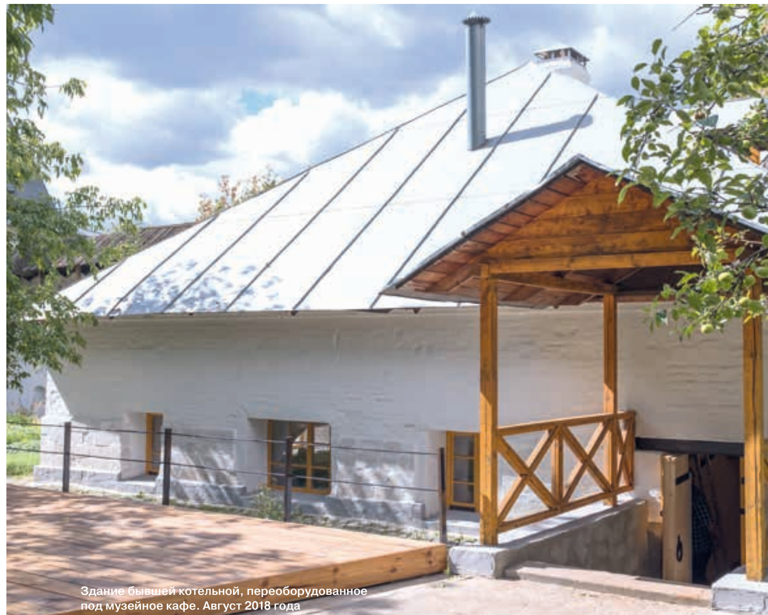
Здание бывшей котельной, переоборудованное под музейное кафе. Август 2018 года