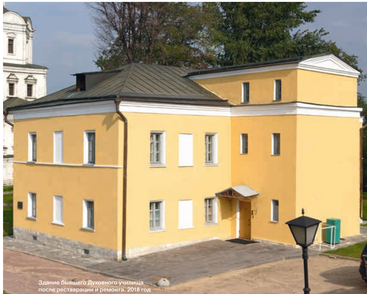
Здание бывшего Духовного училища после реставрации и ремонта. 2018 год