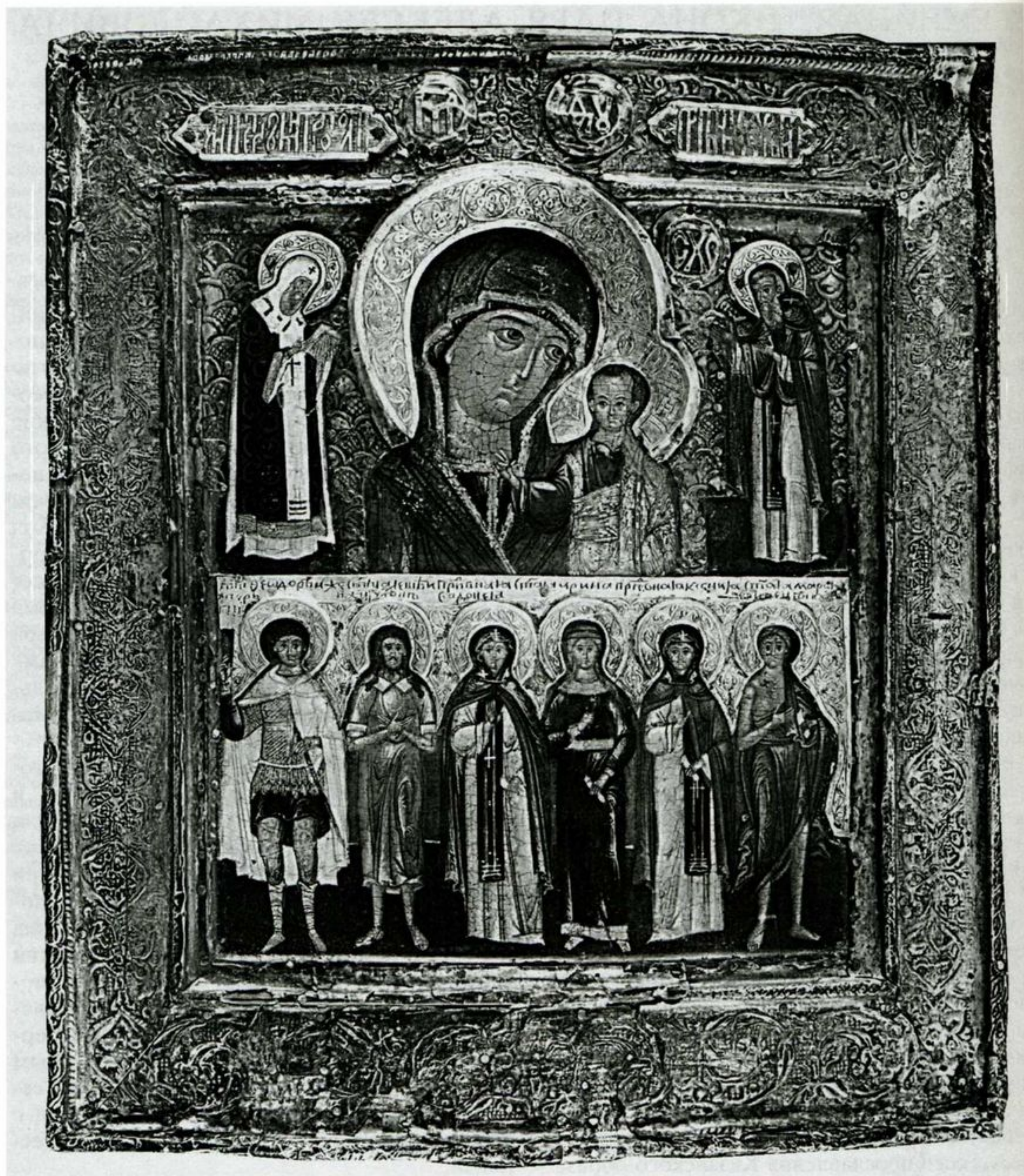
Богородица Казанская с избранными святыми. Икона- двухрядница. Середина XVII в. (ок. 1650 г.). Москва

дили и в деисусный ряд иконостасов. На иконе-двухряднице праведный Алексей изображен согласно иконописному подлиннику со скрещенными на груди руками, "руки к сердцу держит".