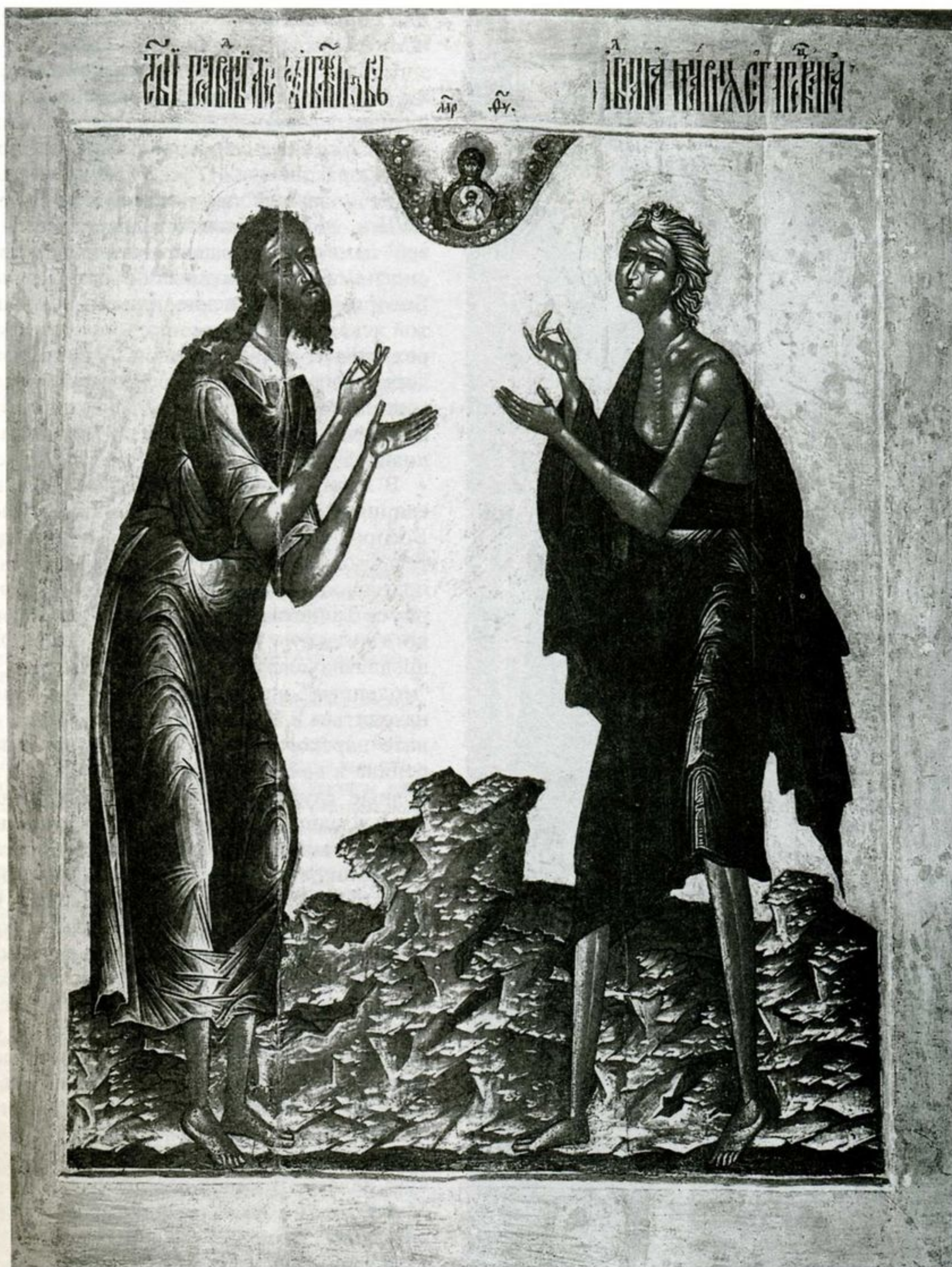
Святой Алексей Человек Божий и преподобная Мария Египетская. Икона из местного ряда иконостаса собора Сретенского монастыря. Середина XVII в. Москва

монастыря (ЦМиАР) 18 . Она располагалась в местном ряду иконостаса собора справа, рядом с местом моления царя. Сретенский монастырь, где существовал древний храм во имя преподобной Марии Египетской, супруги посещали, кроме других праздников, 1 апре-