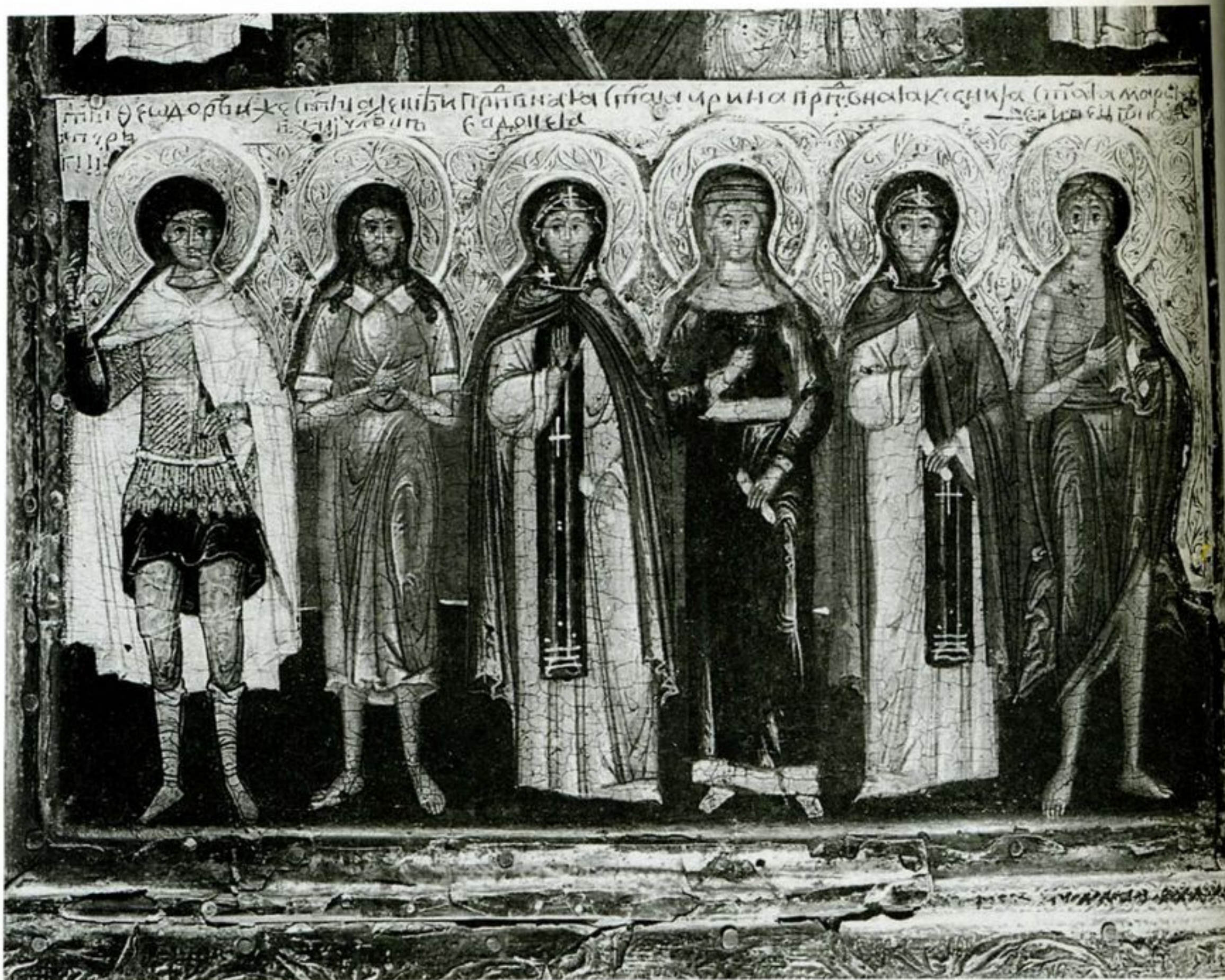
Избранные святые. Нижний ряд иконы- двухрядницы

ри царя Алексея Михайловича было 1 марта, в день преподобномученицы Евдокии 11 . В небольшой Евдокиинской церкви в государственном Кремлевском дворце на “сенех” (в верхнем ярусе дворца), устроенной в 1627 г. в честь “ангела” Евдокии Лукьяновны, совершались богослужения также и в день именин и рождения старшей дочери. Царь Алексей Михайлович очень часто говел и причащался в этом домовом храме 12 .