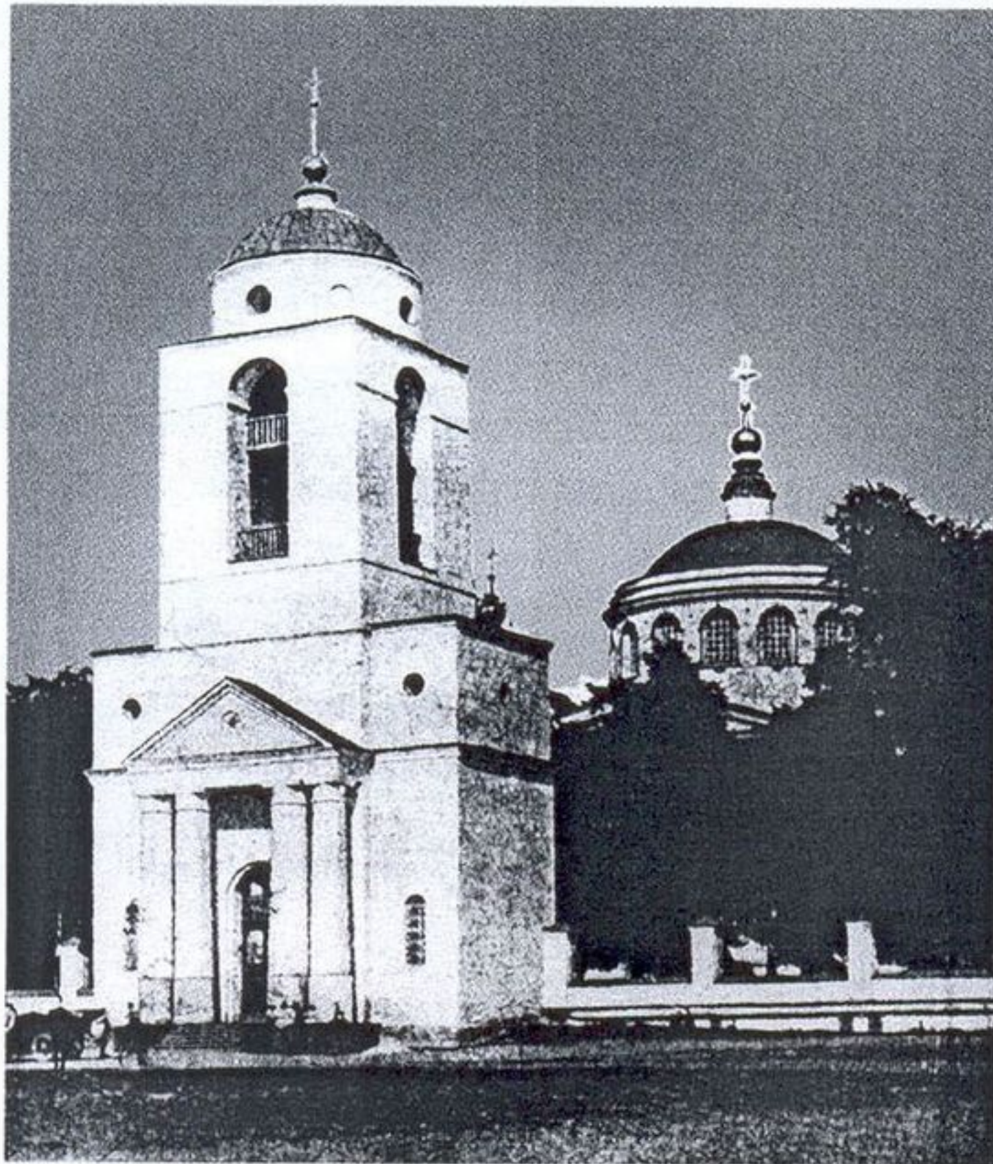
37. Церковь Рождества Богородицы в Каплуновке. 1788–1798 гг. Фото начала XX в.