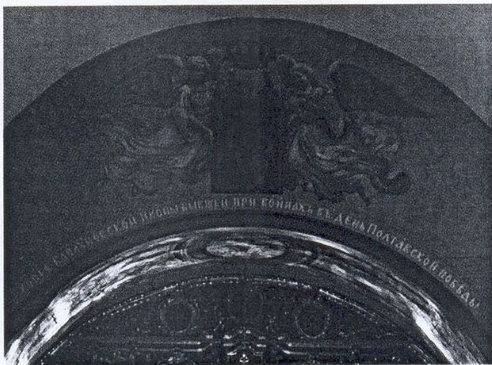
36. Каплуновская Казанская икона Богоматери, несомая Ангелами. Начало XX в. (?) Сампсоньевский собор в Санкт-Петербурге. 1728–1740 гг. Интерьер. Фрагмент.