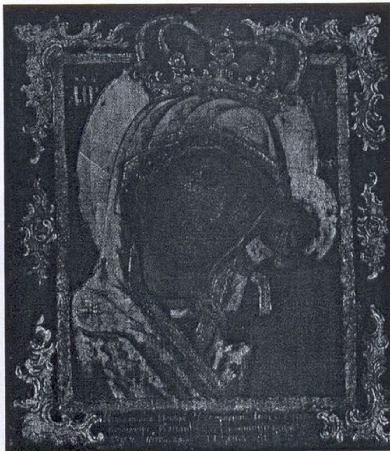
35. Каплуновская Казанская икона Богоматери. Середина – вторая половина XVIII в. Государственный Эрмитаж, г. Санкт-Петербург