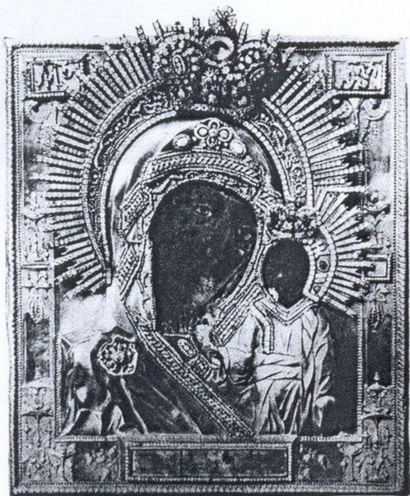
34. Каплуновская Казанская икона Богоматери. 1680-е гг. Оклад – начало XIX в. Фото начала XX в. Публикуется впервые.