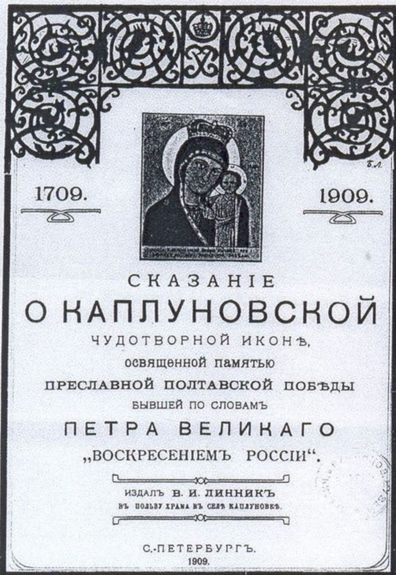
38. Титульный лист книги: Божемянов И. Сказание о Каплуновской чудотворной иконе, освященной памятью преславной Полтавской победы, бывшей по словам Петра Великого «Воскресением России». СПб., 1909.