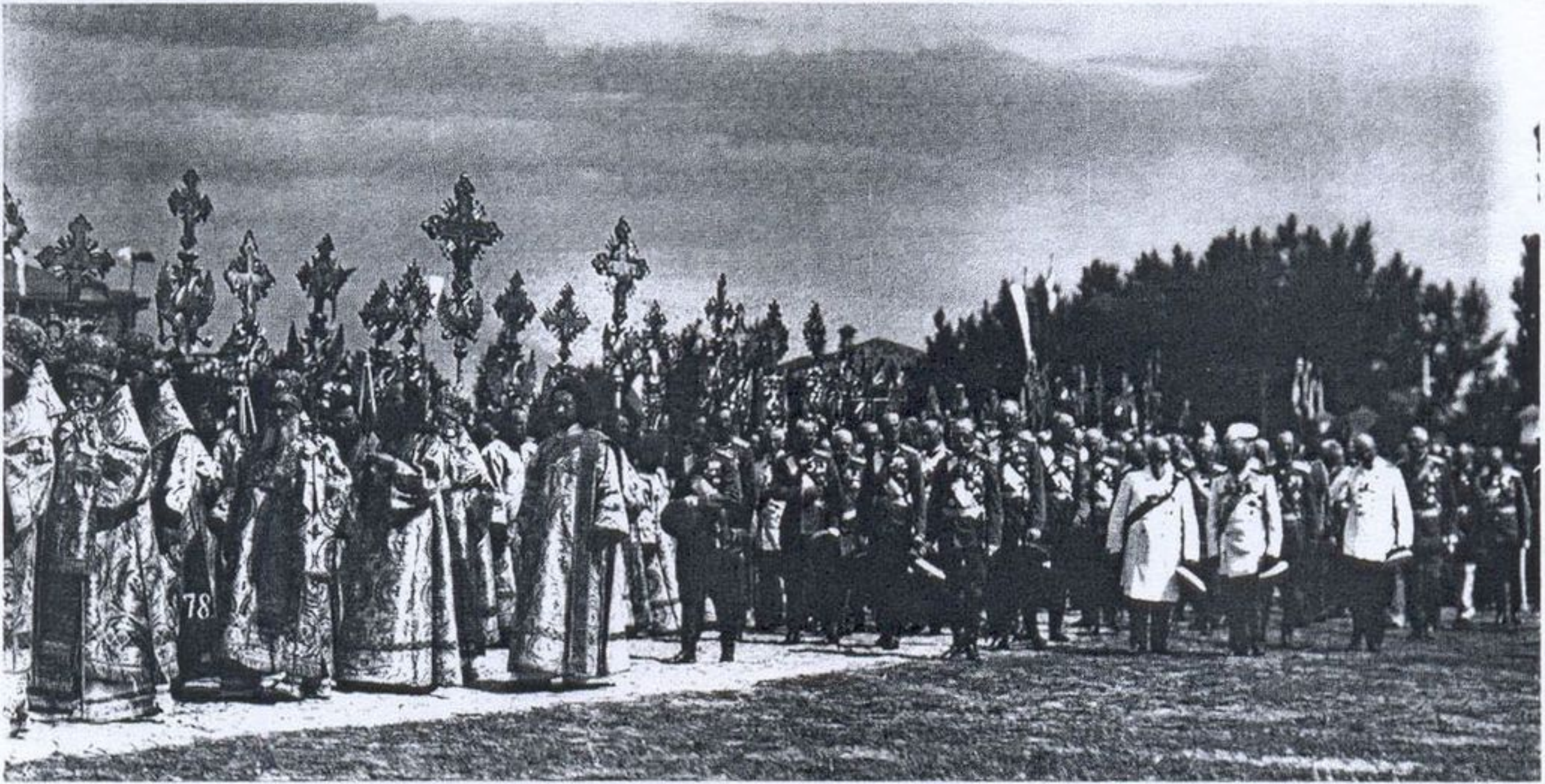
39. Крестный ход, посвященный 200-летию Полтавской победы. 1909 г. Фото начала XX в.