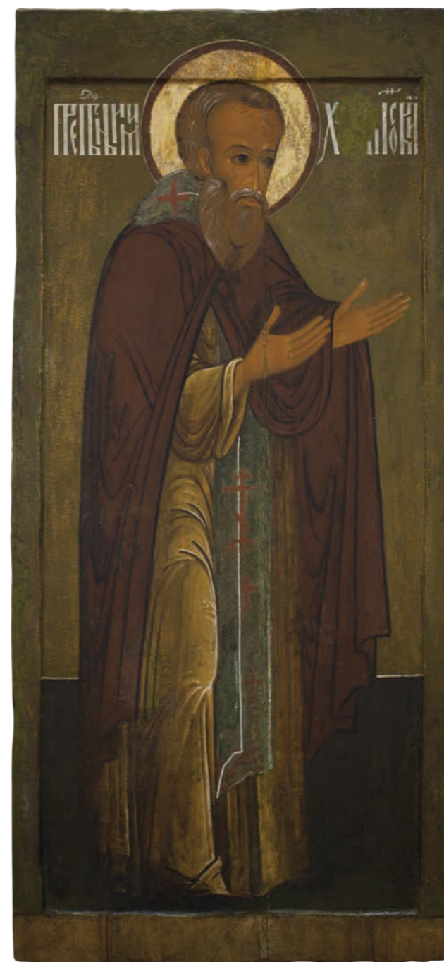
15. Преподобный Михаил Клопский Дерево, темпера. 111,5×52,5