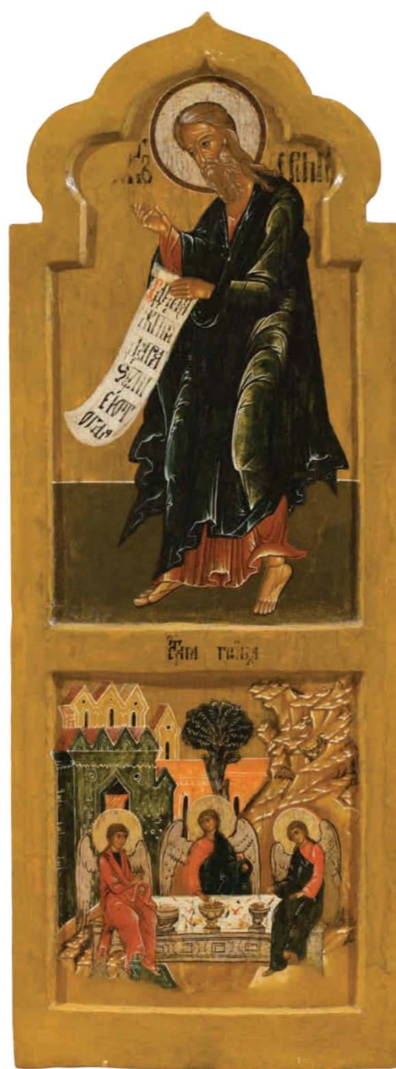
27. Пророк Иеремия. Святая Троица Дерево, темпера. 106×39,5