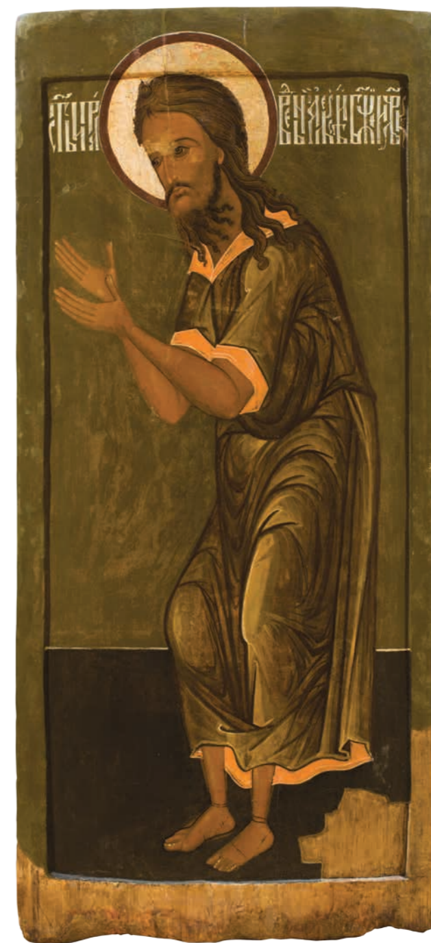
16. Святой Алексий человек Божий Дерево, темпера. 111×52