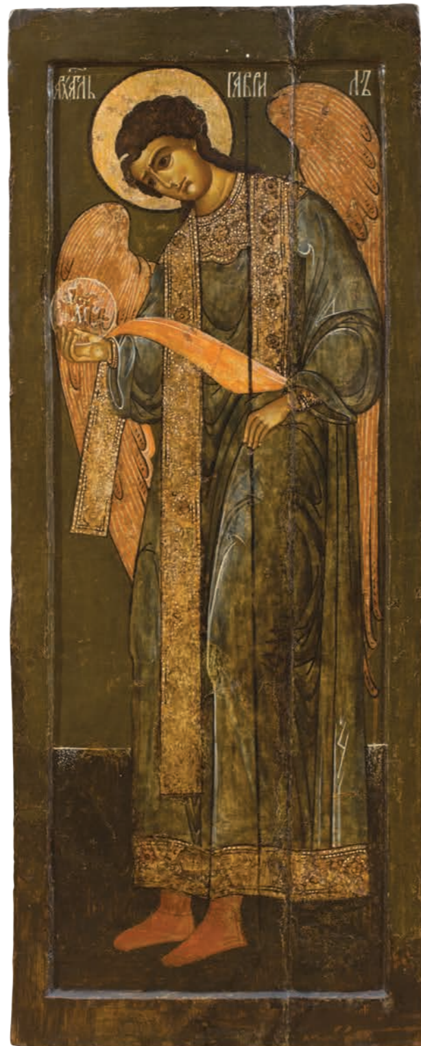
10. Архангел Гавриил Дерево, темпера. 112×44