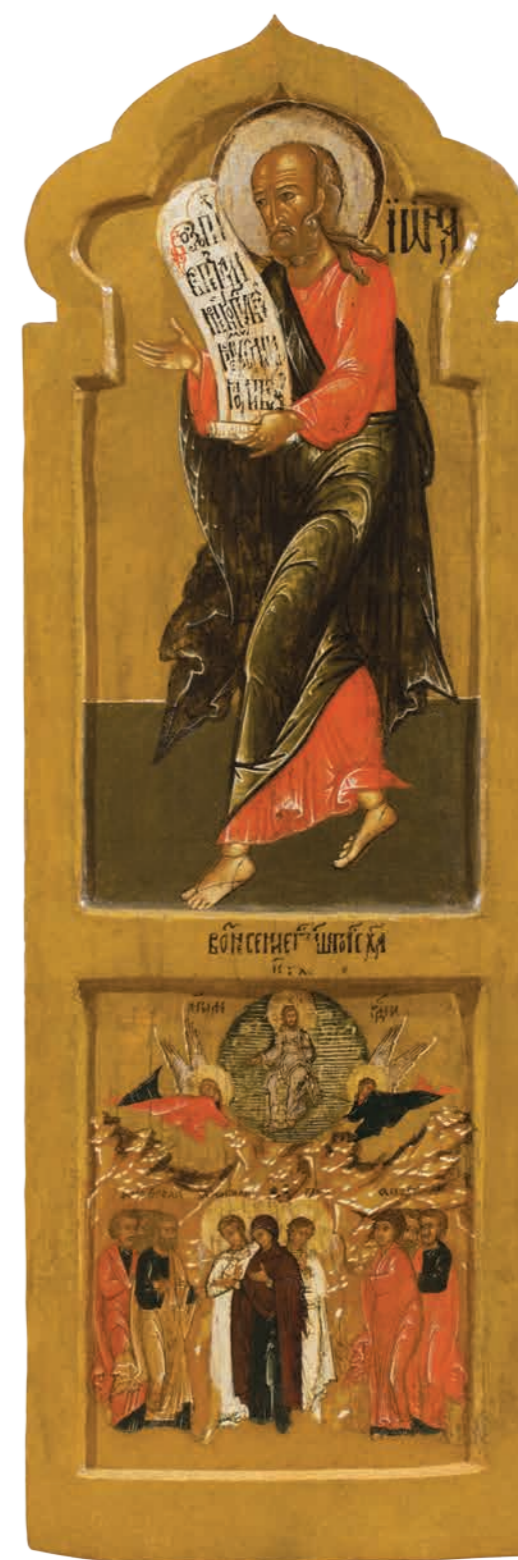
25. Пророк Иона. Вознесение Дерево, темпера. 106×36