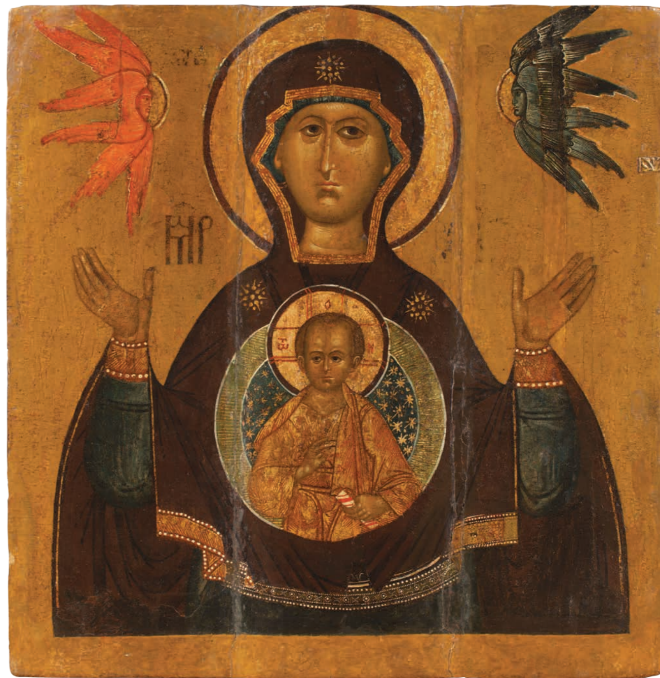
3. Богоматерь Знамение Средник пророческого ряда иконостаса Около 1624 года. Подмосковье Дерево, темпера. 99×96