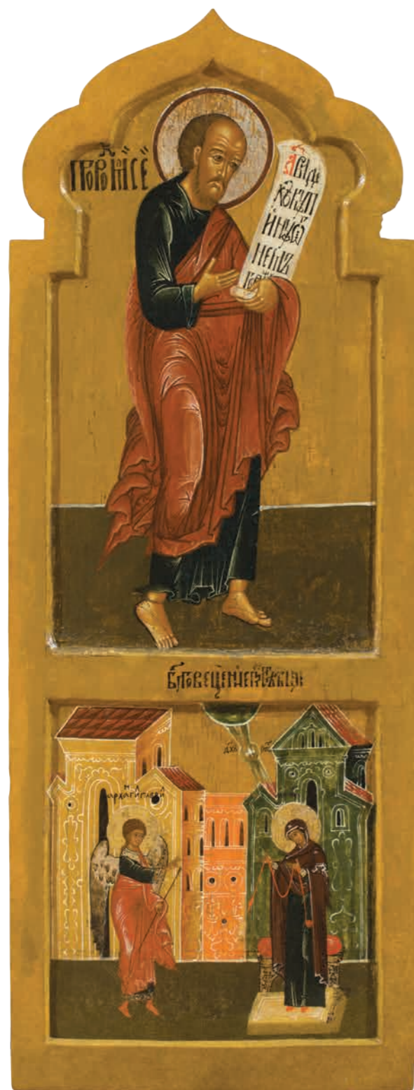
30. Пророк Моисей. Благовещение Дерево, темпера. 107×41