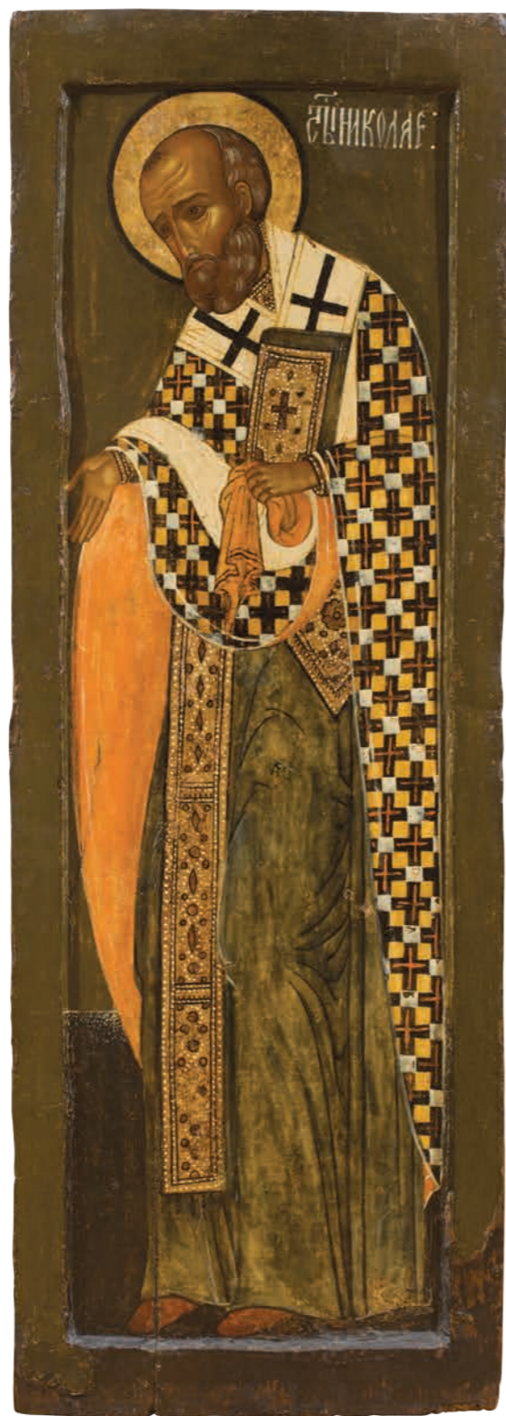
14. Святитель Николай Мирликийский Дерево, темпера. 113×40