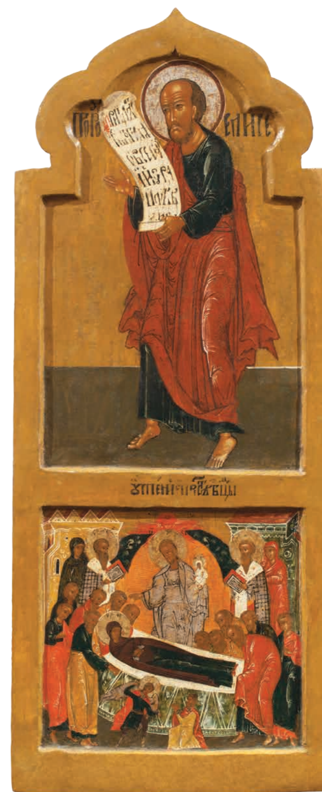
29. Пророк Елисей. Успение Богоматери Дерево, темпера. 107×44