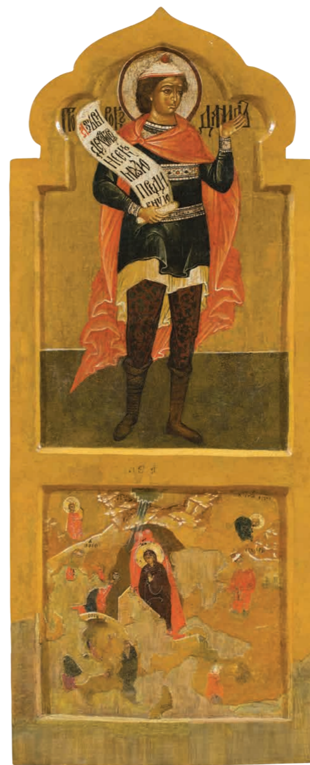
28. Пророк Даниил. Рождество Христово Дерево, темпера. 105×43,5