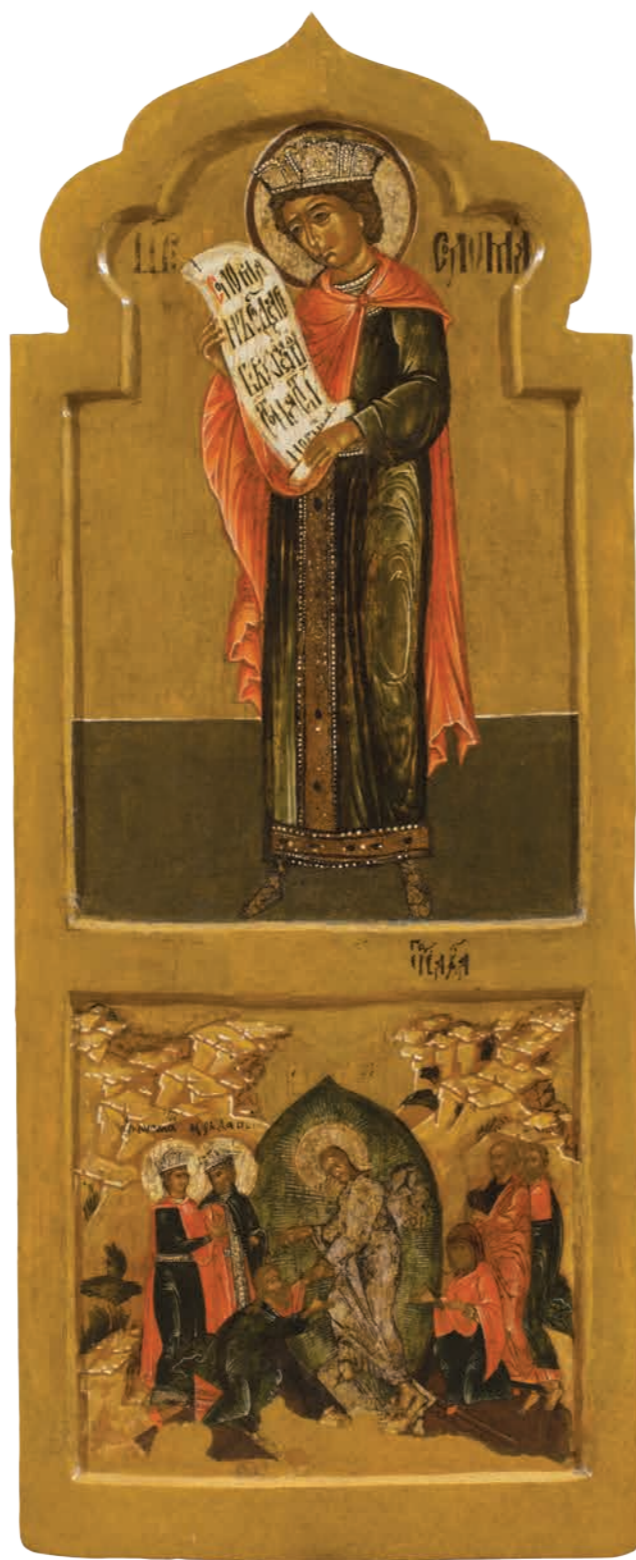
23. Пророк Соломон. Сошествие во ад Дерево, темпера. 107×44