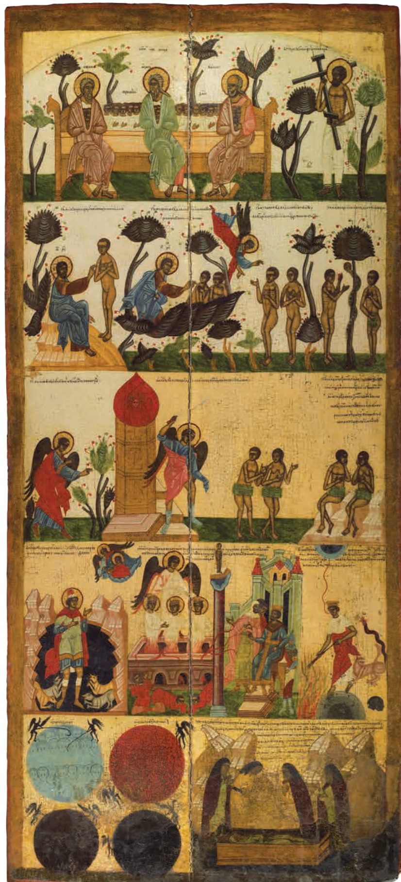
1. Дверь в жертвенник Конец XVI века. Подмосковье Троице-Сергиев монастырь (?) Дерево, темпера. 163×75