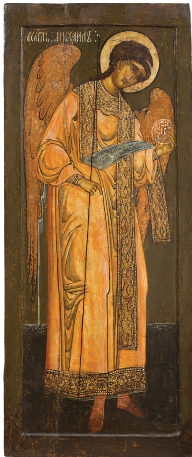
9. Архангел Михаил Дерево, темпера. 112,5×47