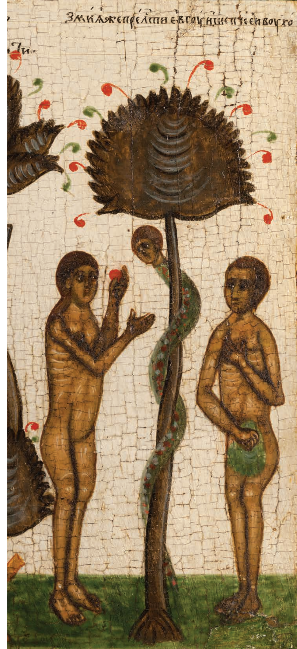
Дверь в жертвенник. Фрагмент Грехопадение