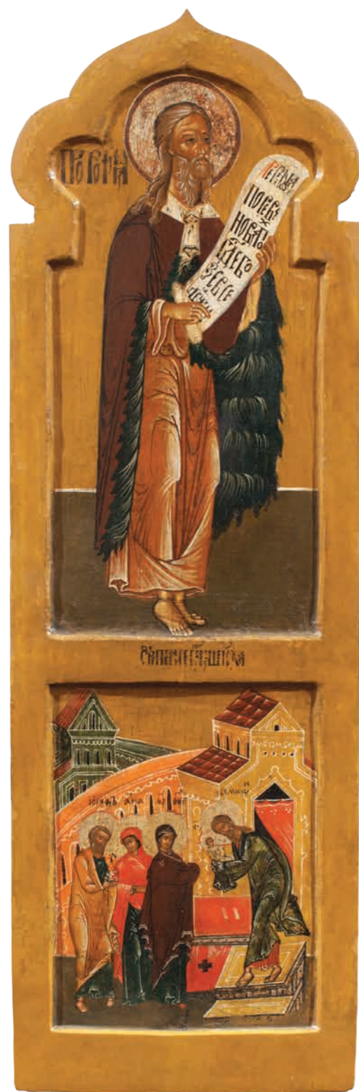
26. Пророк Илия. Сретение Дерево, темпера. 107×35,5