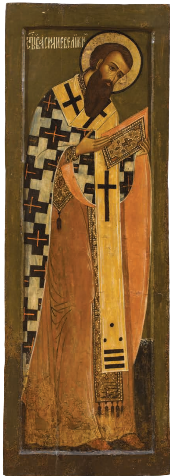
13. Святитель Василий Великий Дерево, темпера. 113×39