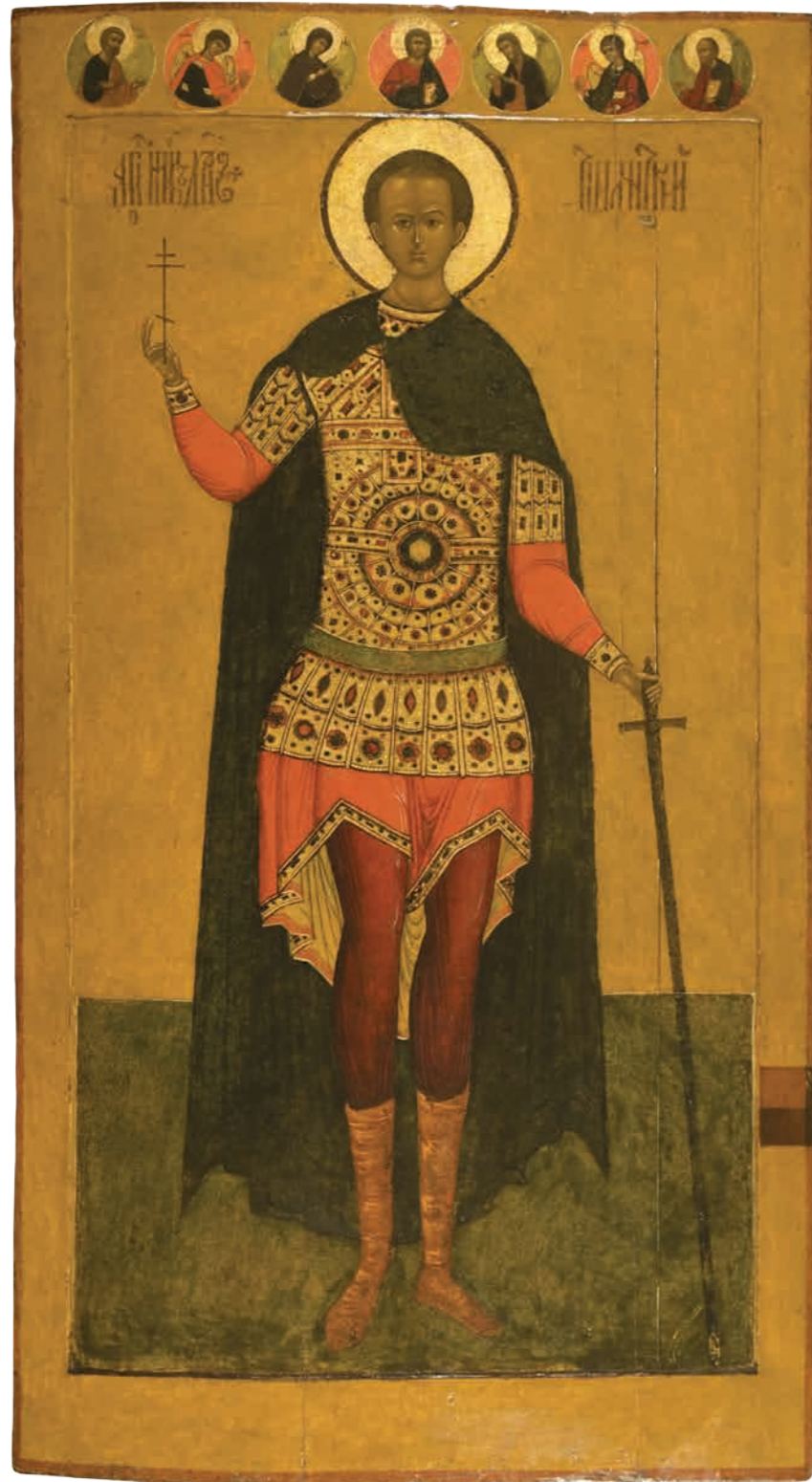
2. Великомученик Димитрий Солунский 1620-е годы. Подмосковье (?) Дерево, темпера. 153×83