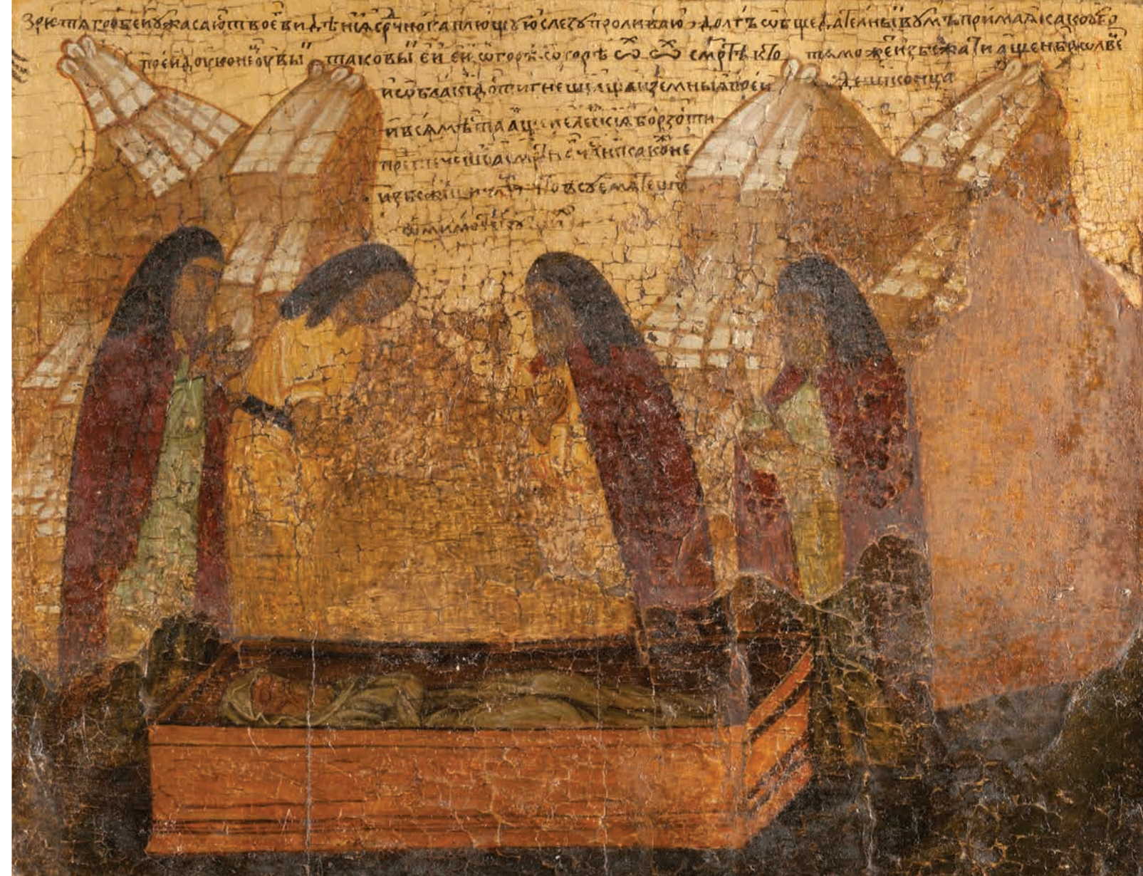
Дверь в жертвенник. Фрагмент Душа чистая