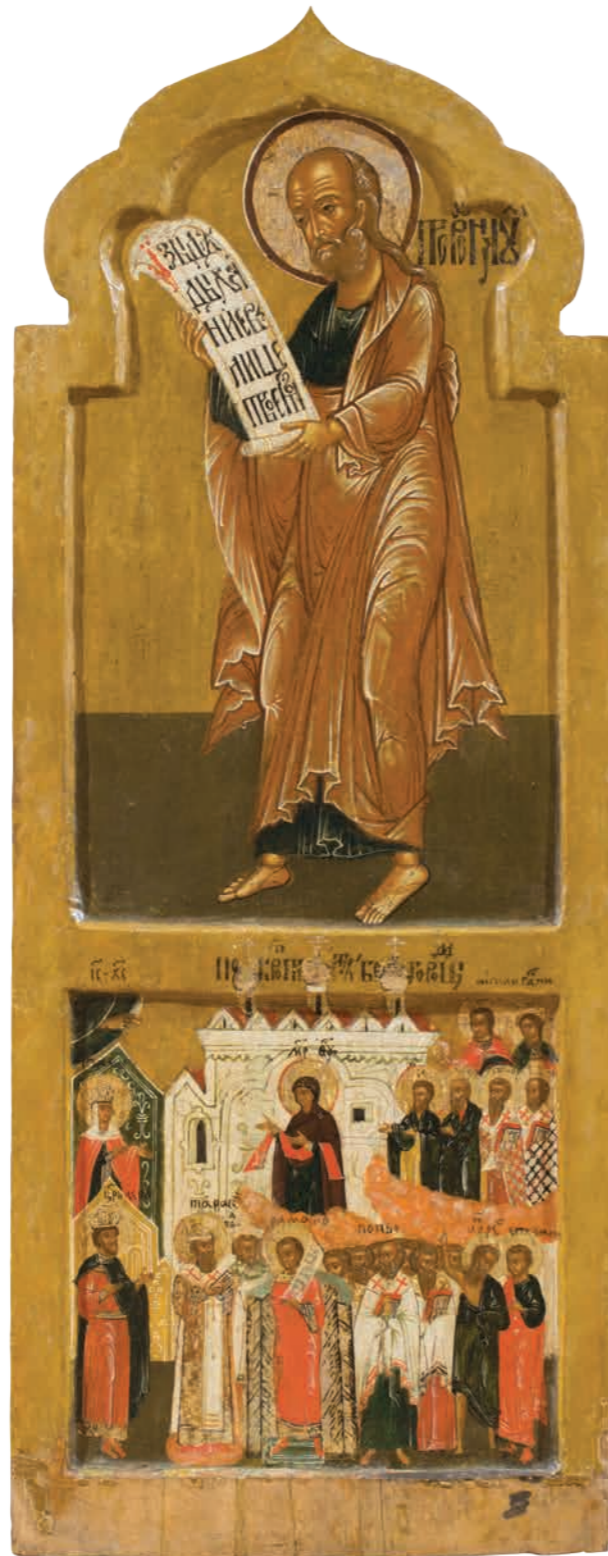
31. Пророк Наум. Покров Богоматери Дерево, темпера. 108×43