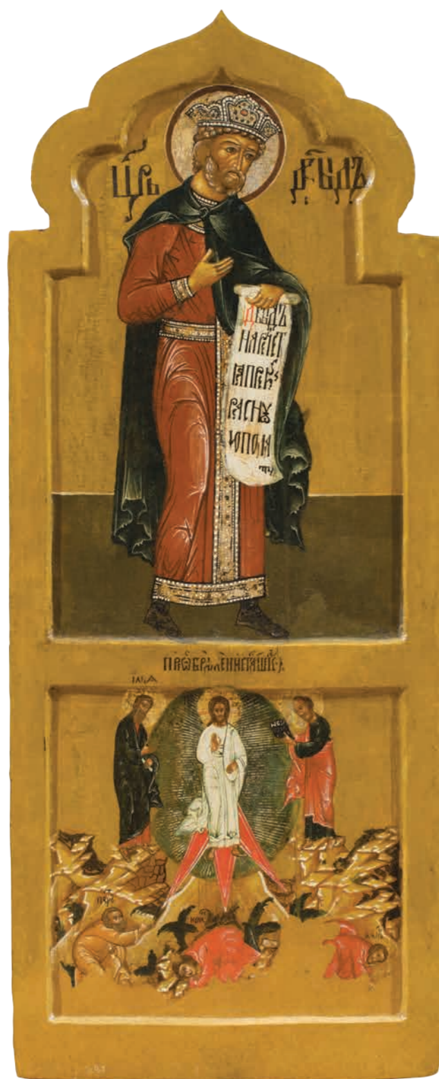
22. Пророк Давид. Преображение Дерево, темпера. 107×42,5