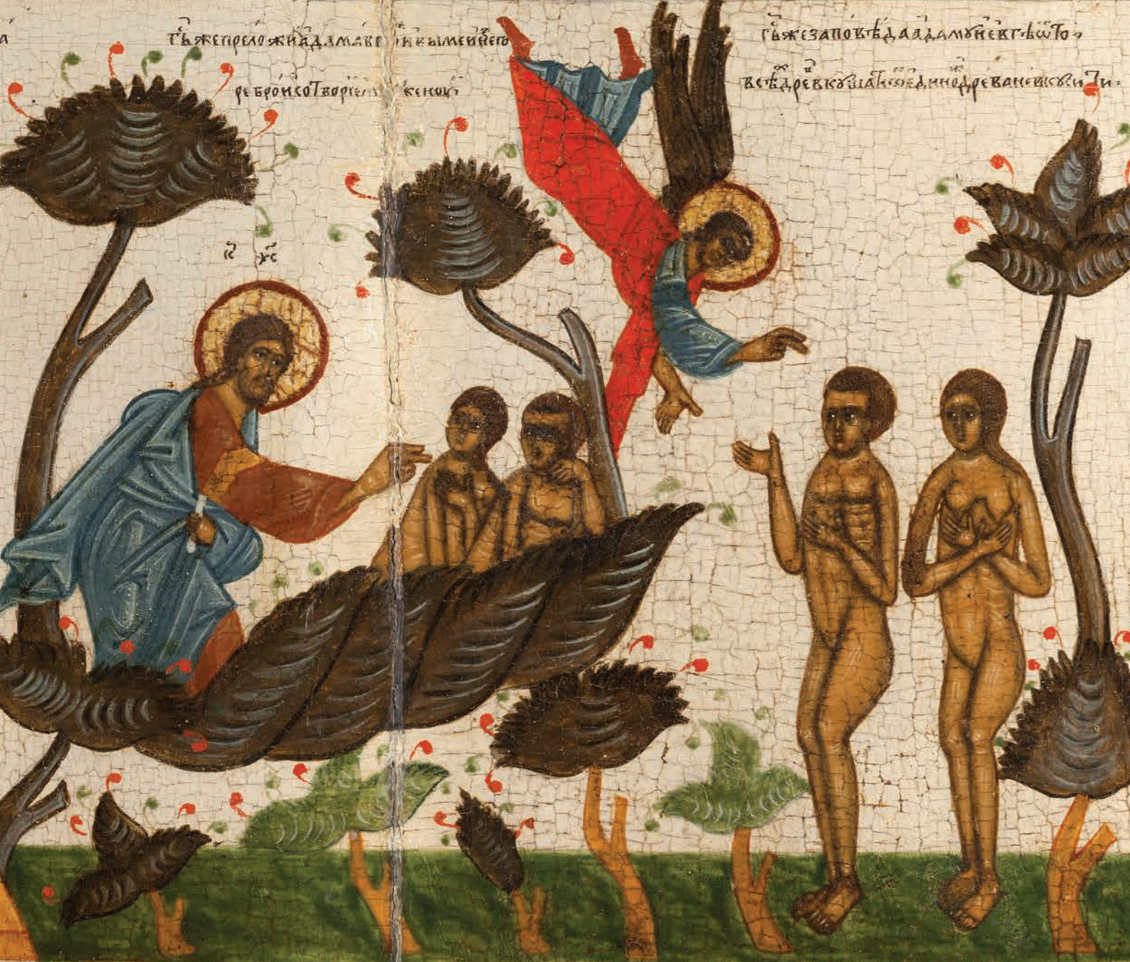
Дверь в жертвенник. Фрагмент Сотворение Евы Заповедь Адаму и Еве