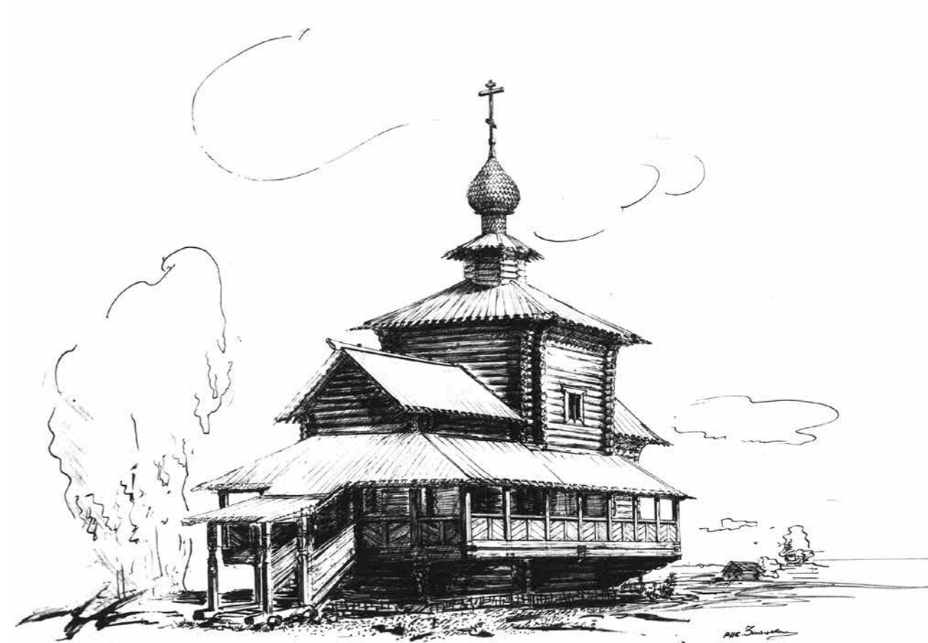
Богоявленская церковь в селе Семеновском. Реконструкция первоначального облика