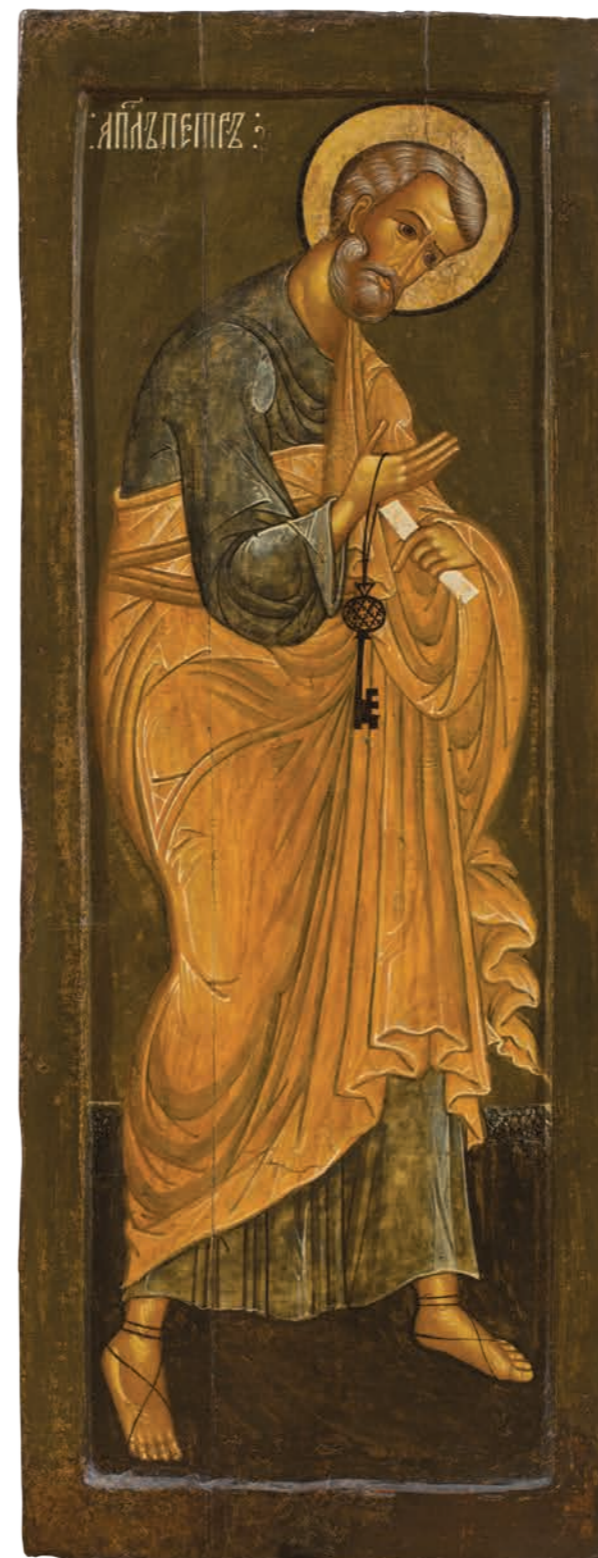
11. Апостол Петр Дерево, темпера. 113×42,5