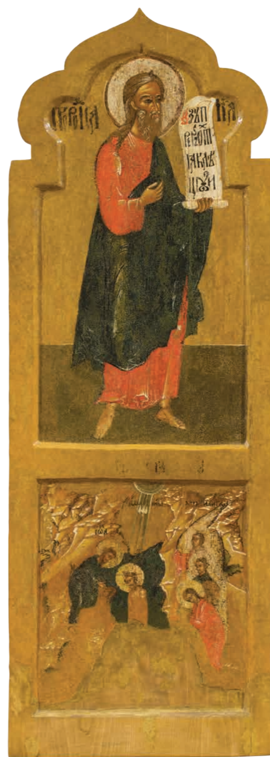
24. Пророк Исаия. Богоявление Дерево, темпера. 102×39,5