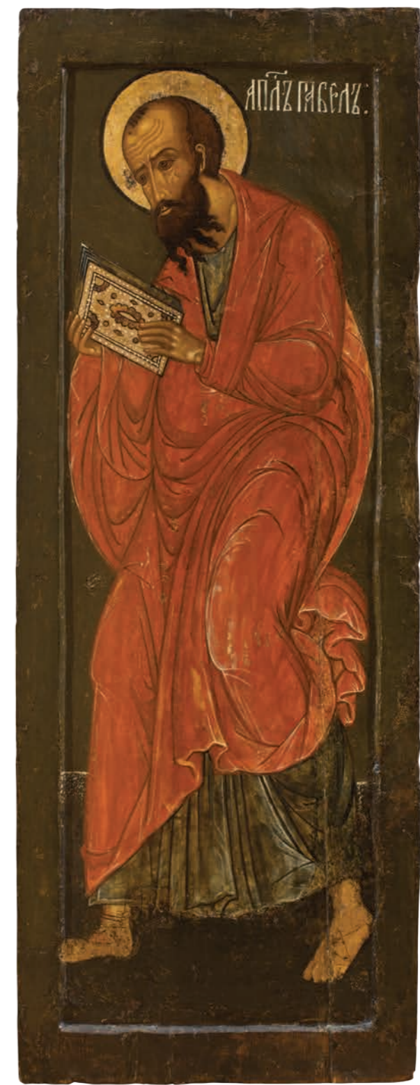
12. Апостол Павел Дерево, темпера. 113×42