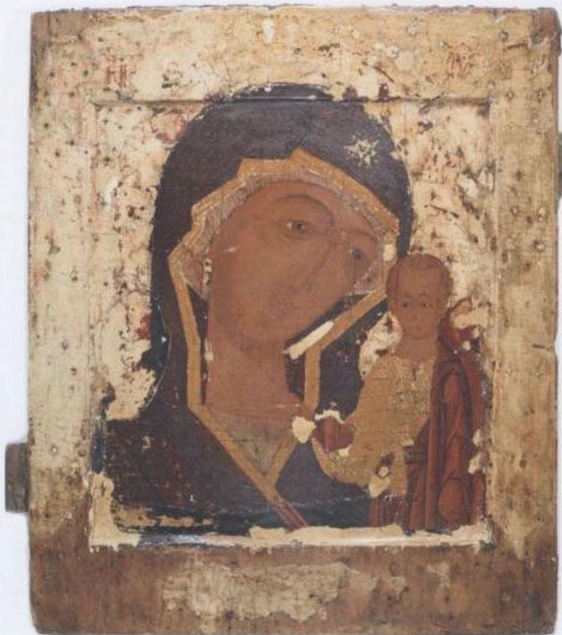
Ил. 3. Богоматерь Казанская. 1580–1590-е годы. Москва (?). Дерево, темпера. Из частного собрания

гословляющего Христа и Богоматерью, держащей левую руку на плече Младенца (КБИАХМЗ).