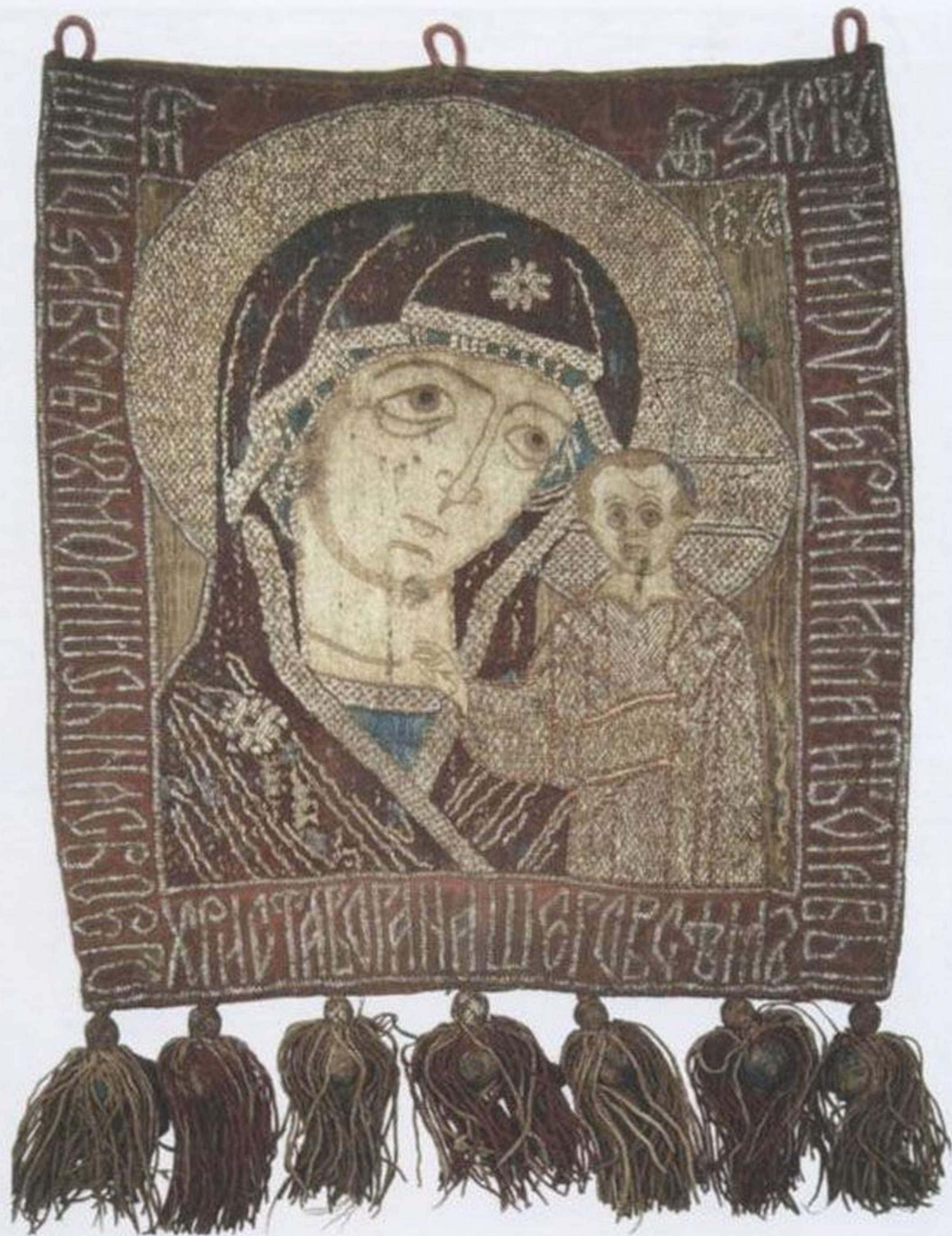
Ил. 1. Богоматерь Казанская. Пелена. 1580–1590-е годы. Казань. Камка, шелк, тафта, золотые, серебряные и шелковые нити. Из собрания Национального музея Республики Татарстан

Внизу на полях внутренней рамы и оклада XVII в. видны отверстия для крепления ручек (внутренняя рама вынималась из внешней для несения в крестных ходах чудотворного образа). Неизвестно, сохранилась ли «праздничная» риза Явленного образа, надевавшаяся на Рождество Христово, Пасху и в дни празднования Казанской иконе. Она была золотая (дар царя Феодора Иоанновича, о ней упоминается в «Повести...» митрополита Ермогена), на которую надевалась вторая жемчужная