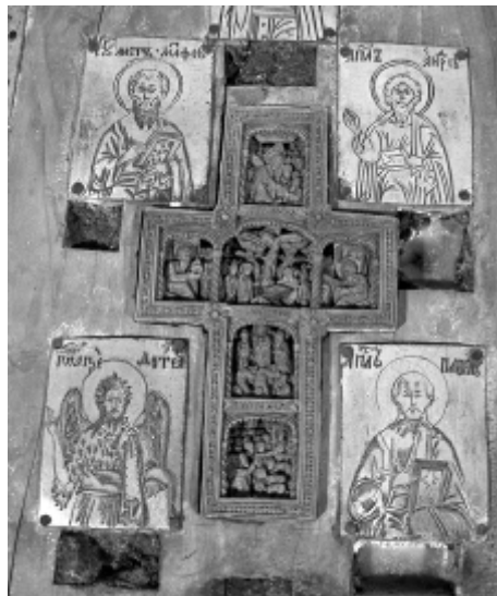
7. Фрагмент вертикального древка креста с врезным крестом с изображением четырех праздников (в центре — «Распятие») и 4 пластины