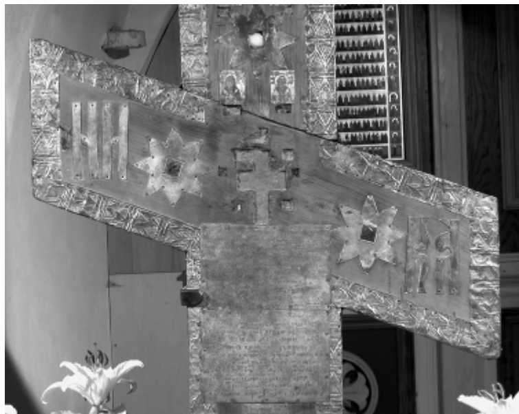
14. Фрагмент нижней косой перекладины Кийского креста и гравированная пластина с летописью