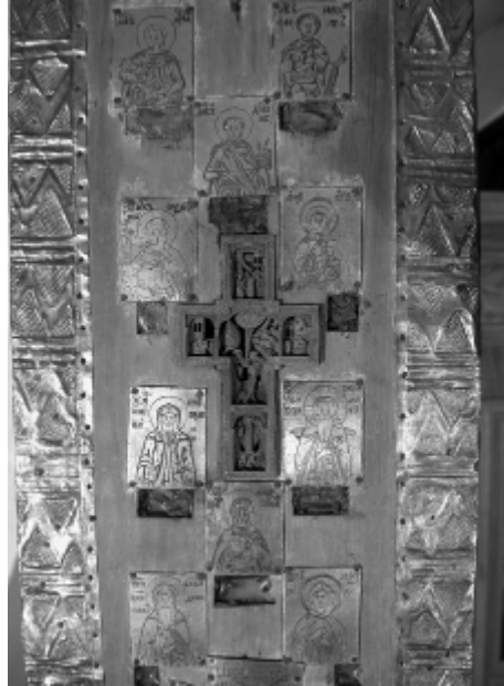
6. Фрагмент вертикального древка с врезным афонским крестом с изображением трех праздников (в центре — «Крещение», вверху — «Благовещение», внизу — «Преображение») и 10 пластин с изображением мучеников и преподобных