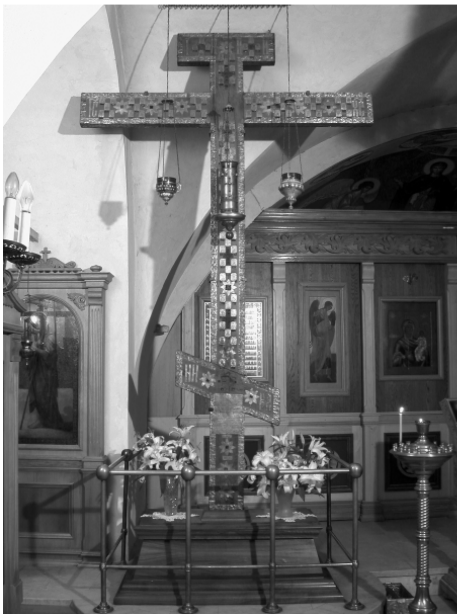
3. Кийский крест. Общий вид