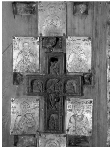
4. Фрагмент вертикального древка: Афонский крест с изображением «Крещения» и 5 пластин