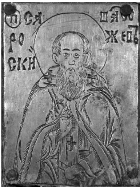
12. Пластина с изображением Саввы Сторожевского (крупный фрагмент)