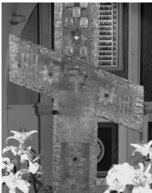
13. Фрагмент нижней косой перекладины Кийского креста и гравированная пластина с летописью