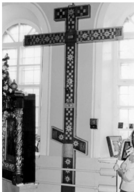
15. Крест-копия «мерой и подобием» Кийского креста в действующем храме г. Онега (копия живописная)