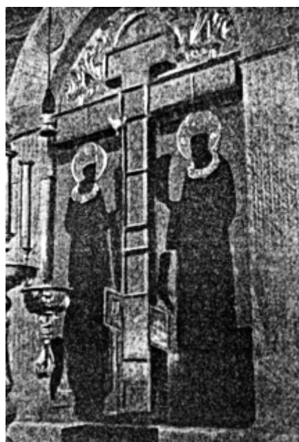
2. Кийский крест в интерьере храма в Крестном Кий-островском монастыре. Гравюра из книги XIX в.