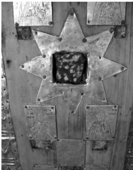
8. Фрагмент вертикального древка креста с изображением восьмиконечной звезды с камнем и изображением новгородских святых