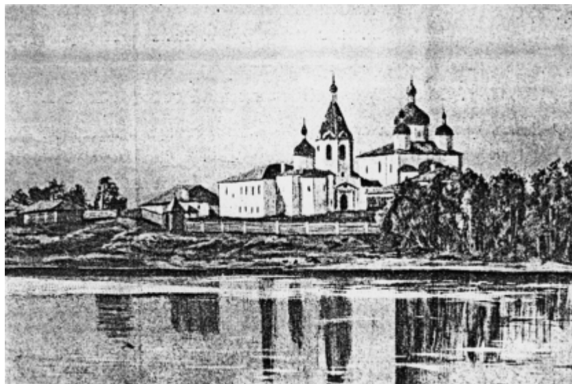
1. Вид Кийского Крестного монастыря из книги XIX в.