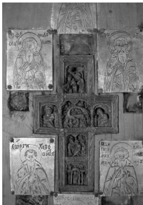
5. Фрагмент вертикального древка: Афонский врезной крест с изображением четырех праздников и 4 пластины