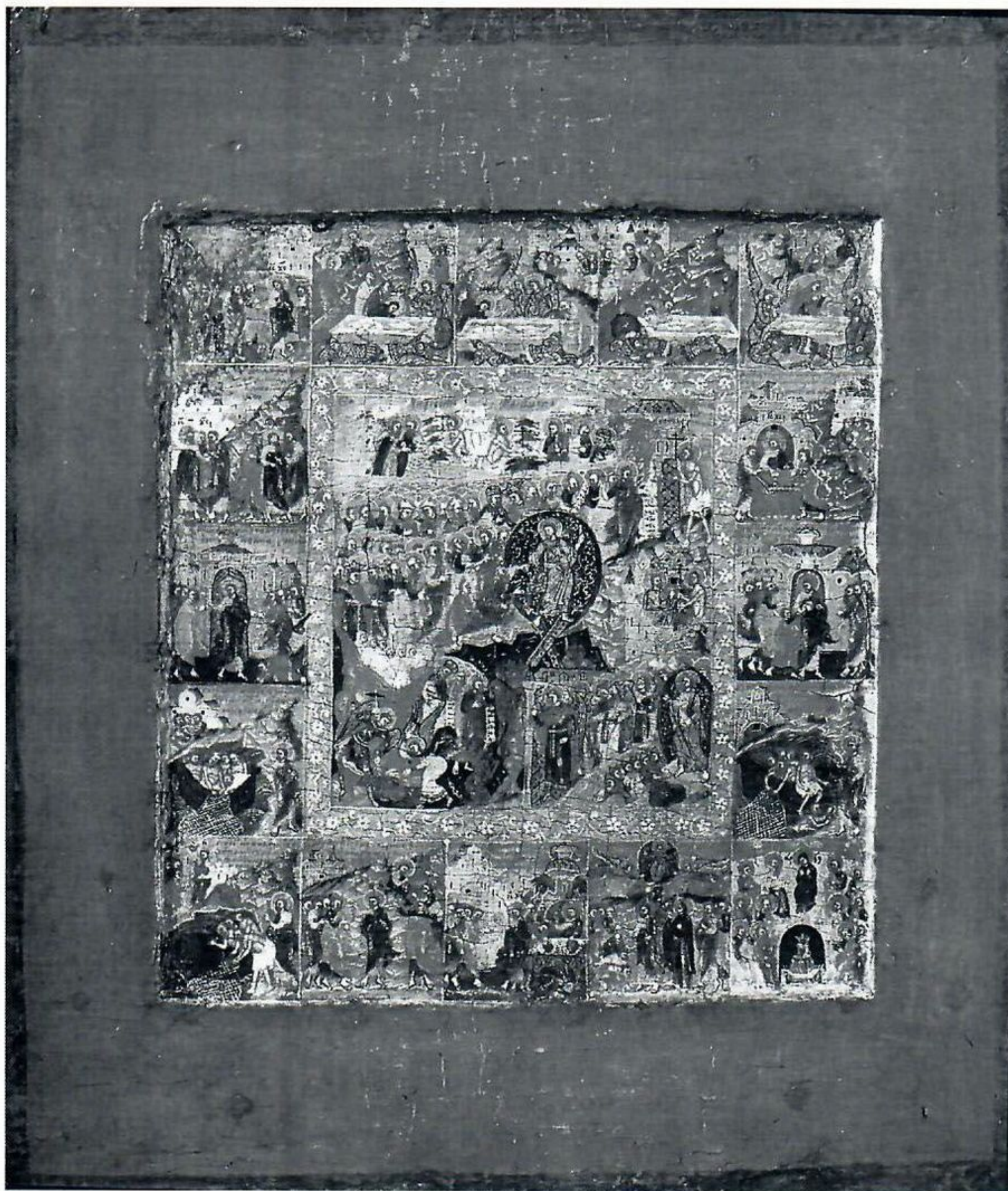
5. Воскресение Христово, с 16 клеймами. Икона. Мастер Никифор Савин. Начало – первая четверть XVII в. Пермская художественная галерея