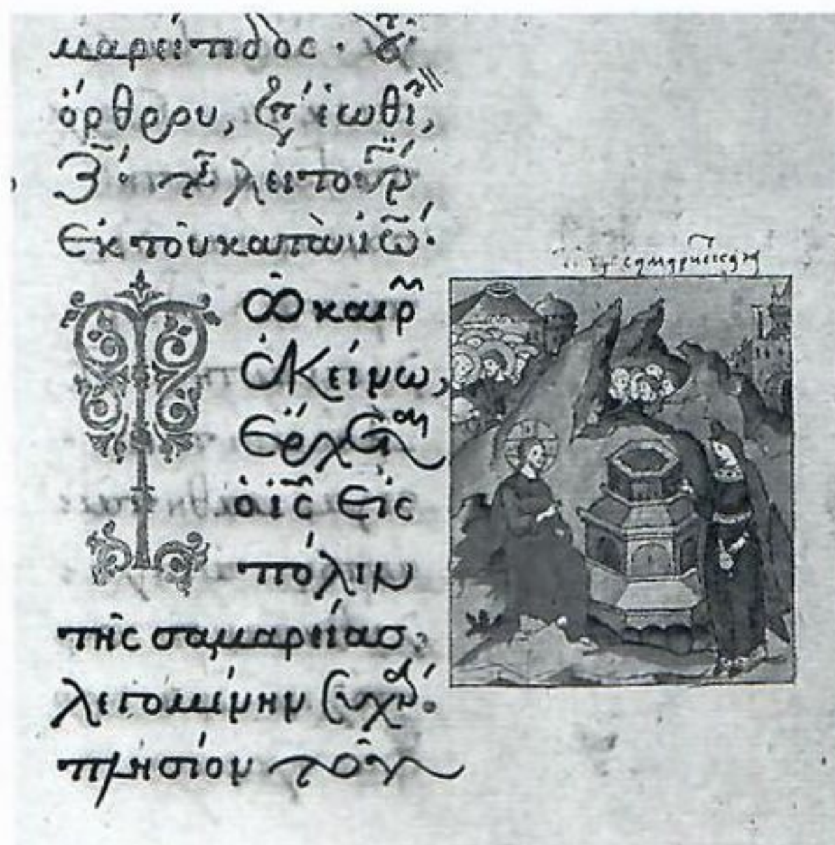
4. Христос и самарянка. Миниатюра. 1594 г. Москва. Евангелие апракос. Уолтерс Арт Музеум, Балтимор (Ms. W. 535. Fol. 39r)