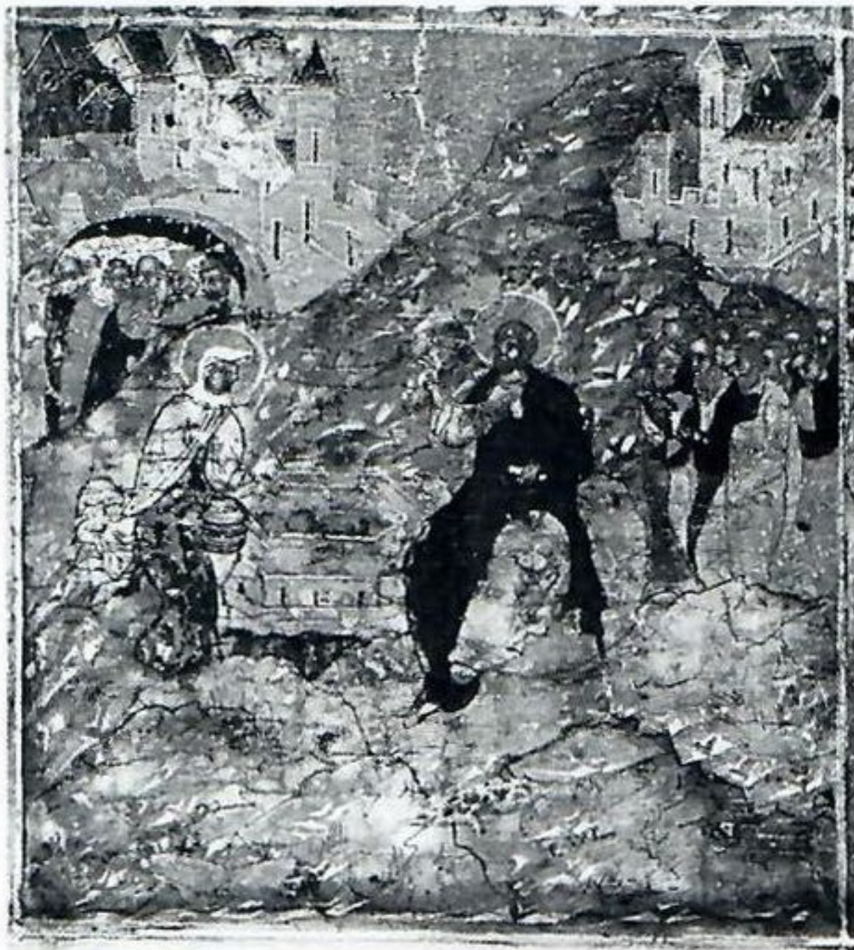
3. Сошествие Святого Духа на апостолов, с 12 клеймами». Икона. Мастер. Никифор Савин. Первая четверть XVII в. Музей имени Андрея Рублева. Клеймо: Христос и самарянка