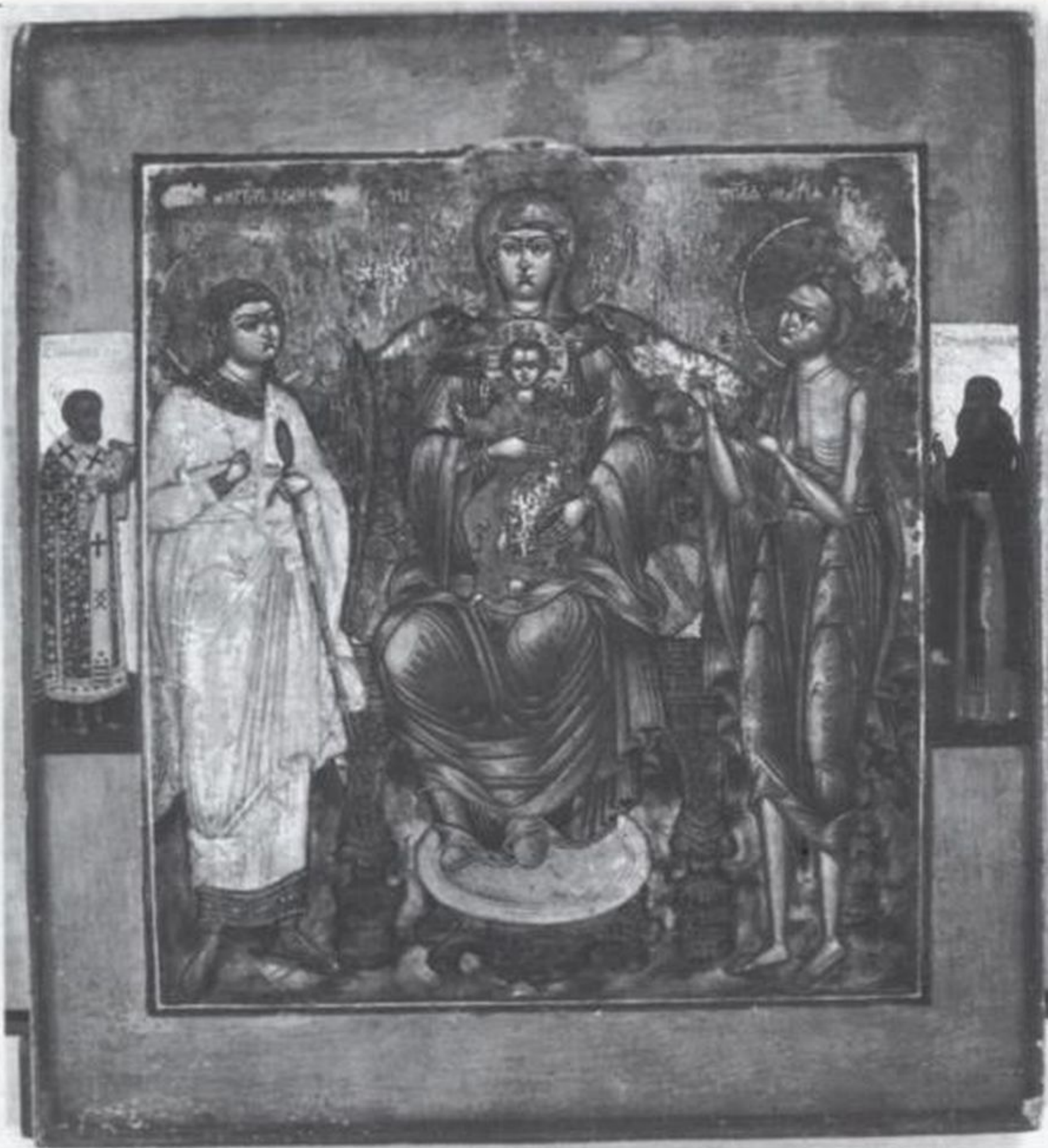
Богоматерь на престоле с Ангелом Хранителем и преп. Марией Египетской, вторая половина XVIII в. Выг