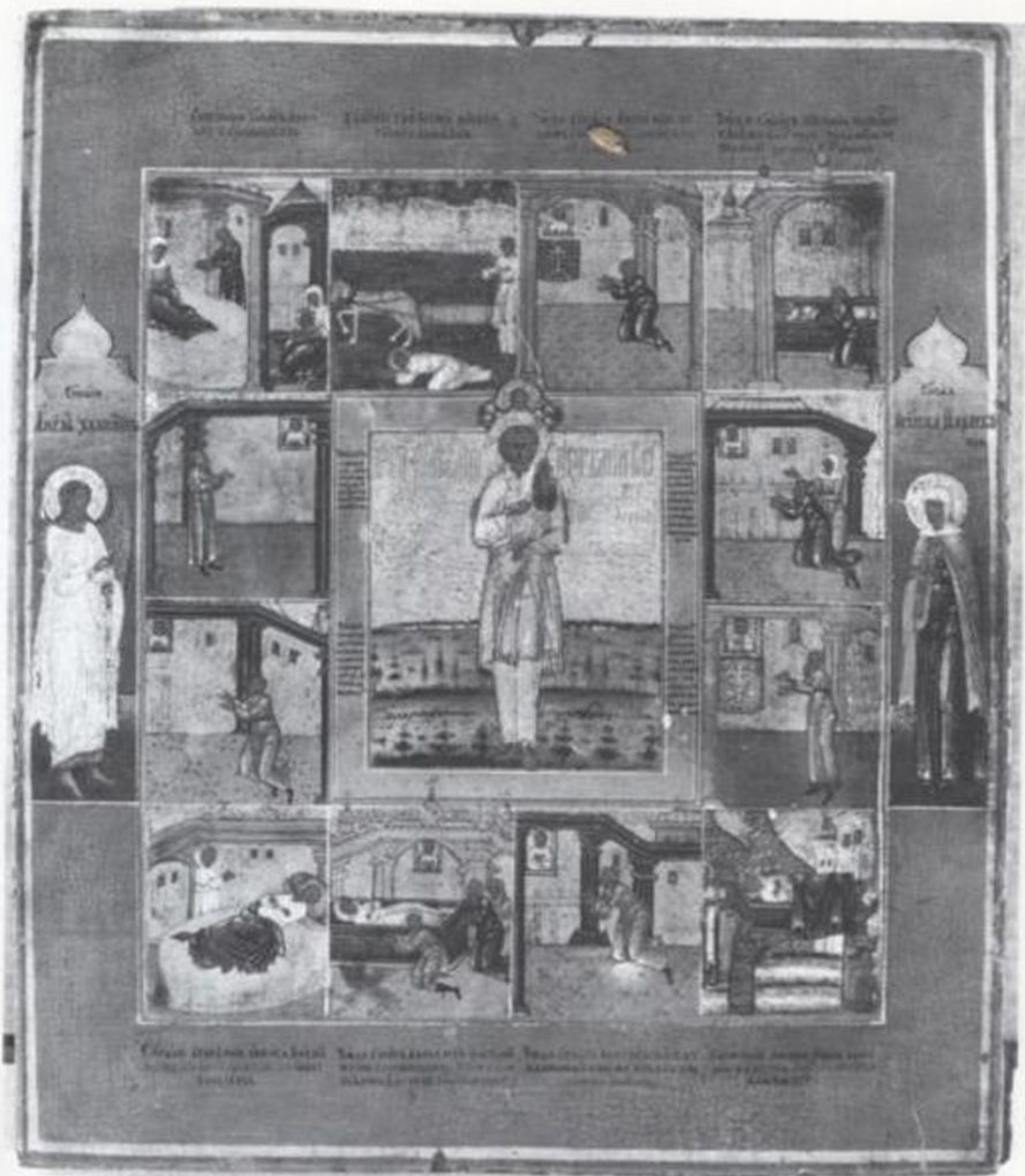
Преп. Артемий Веркольский с 12 клеймами жития, первая треть XIX в. Поморье, Выг (?)