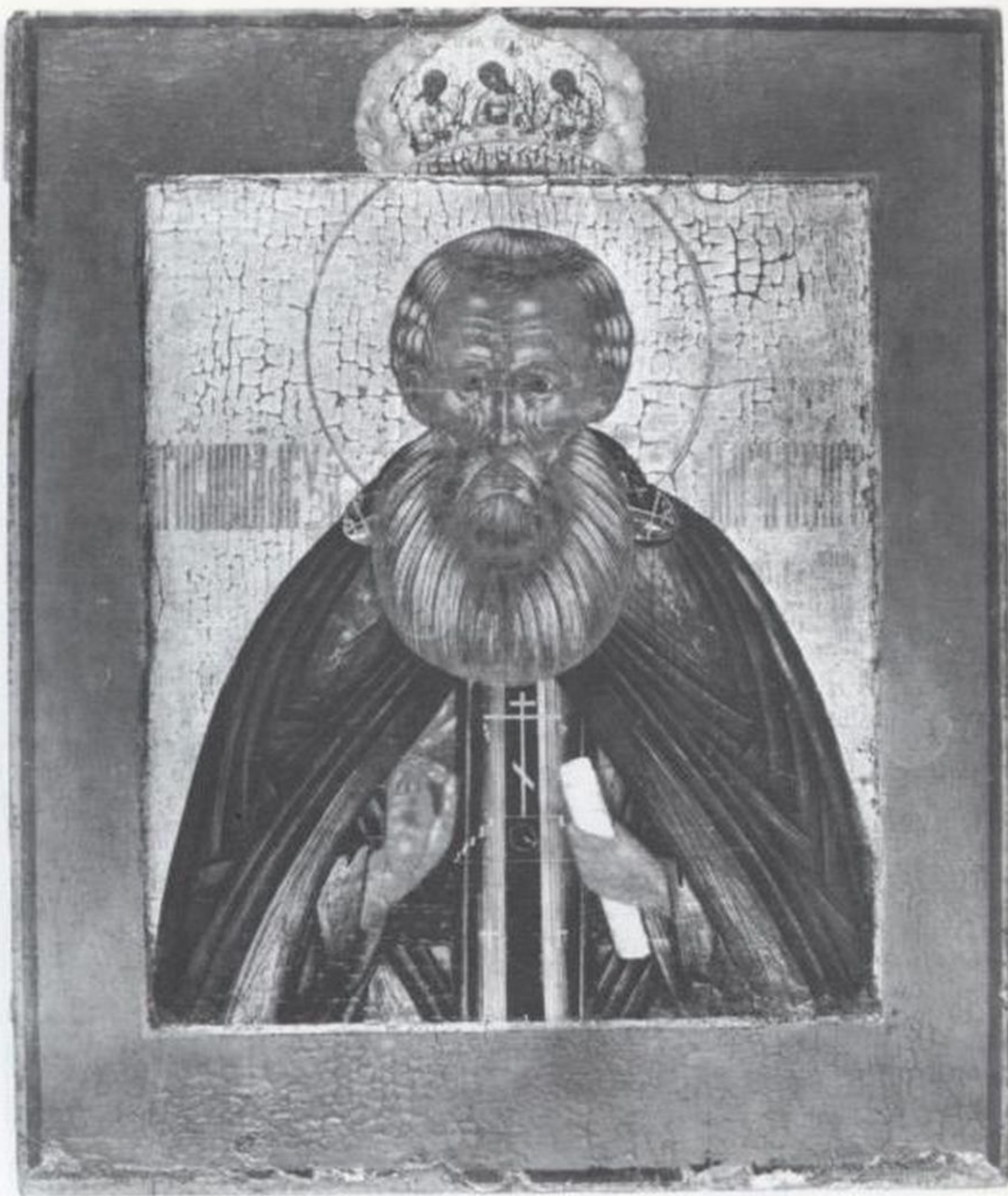
Преп. Александр Свирский поясной, конец XVIII — начало XIX в. Заонежье