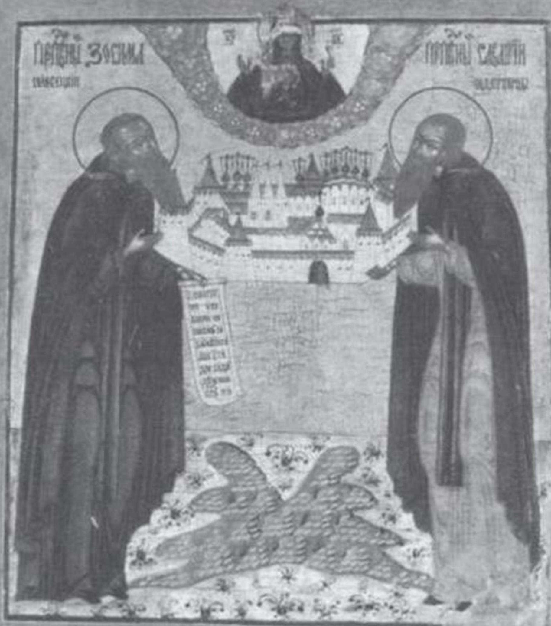
Преп. Зосима и Савватий с изображением монастыря, начало XIX в. Выг