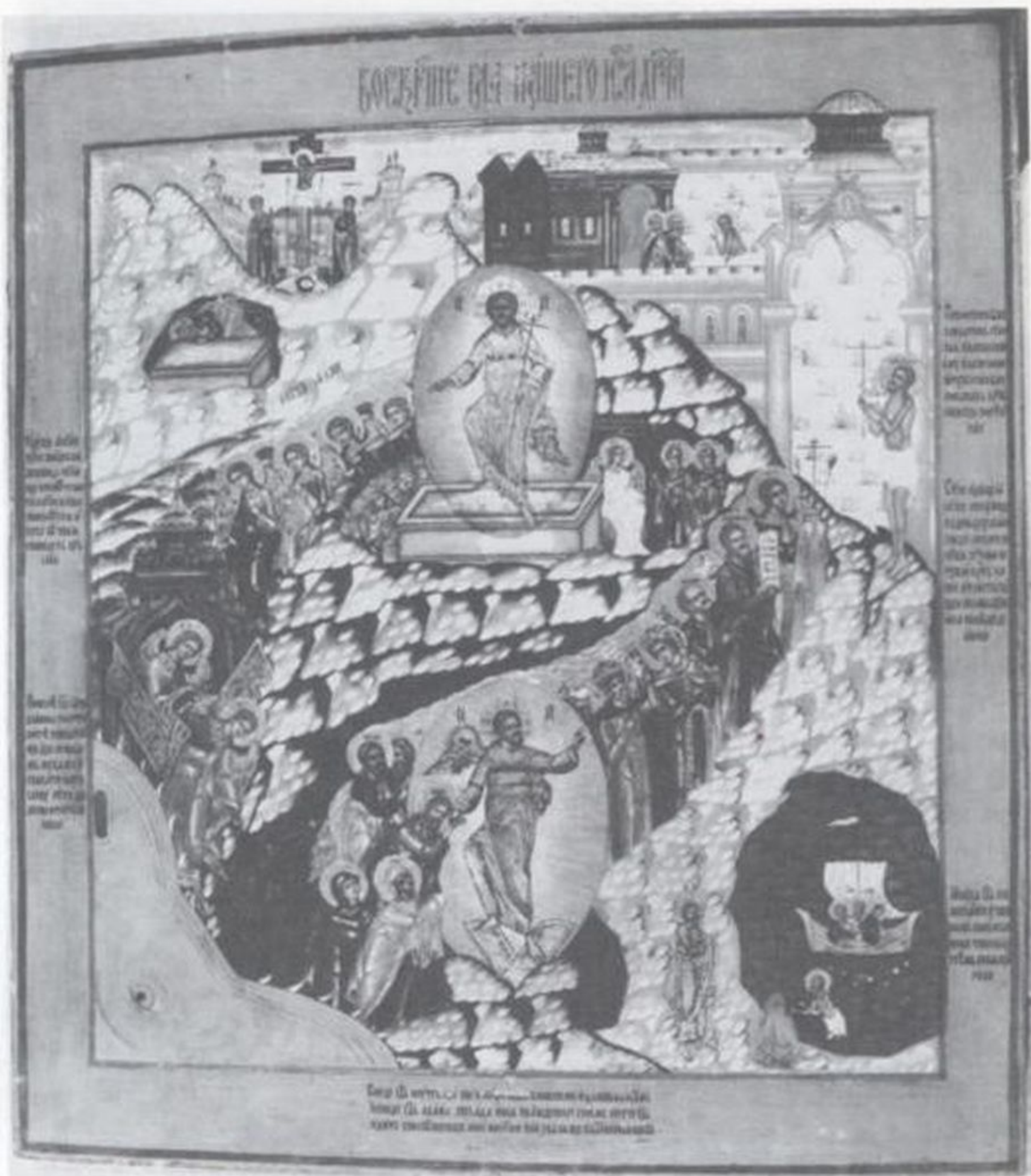
Воскресение Христово — Сошествие во ад, первая треть XIX в. Поморье, Выг (?)