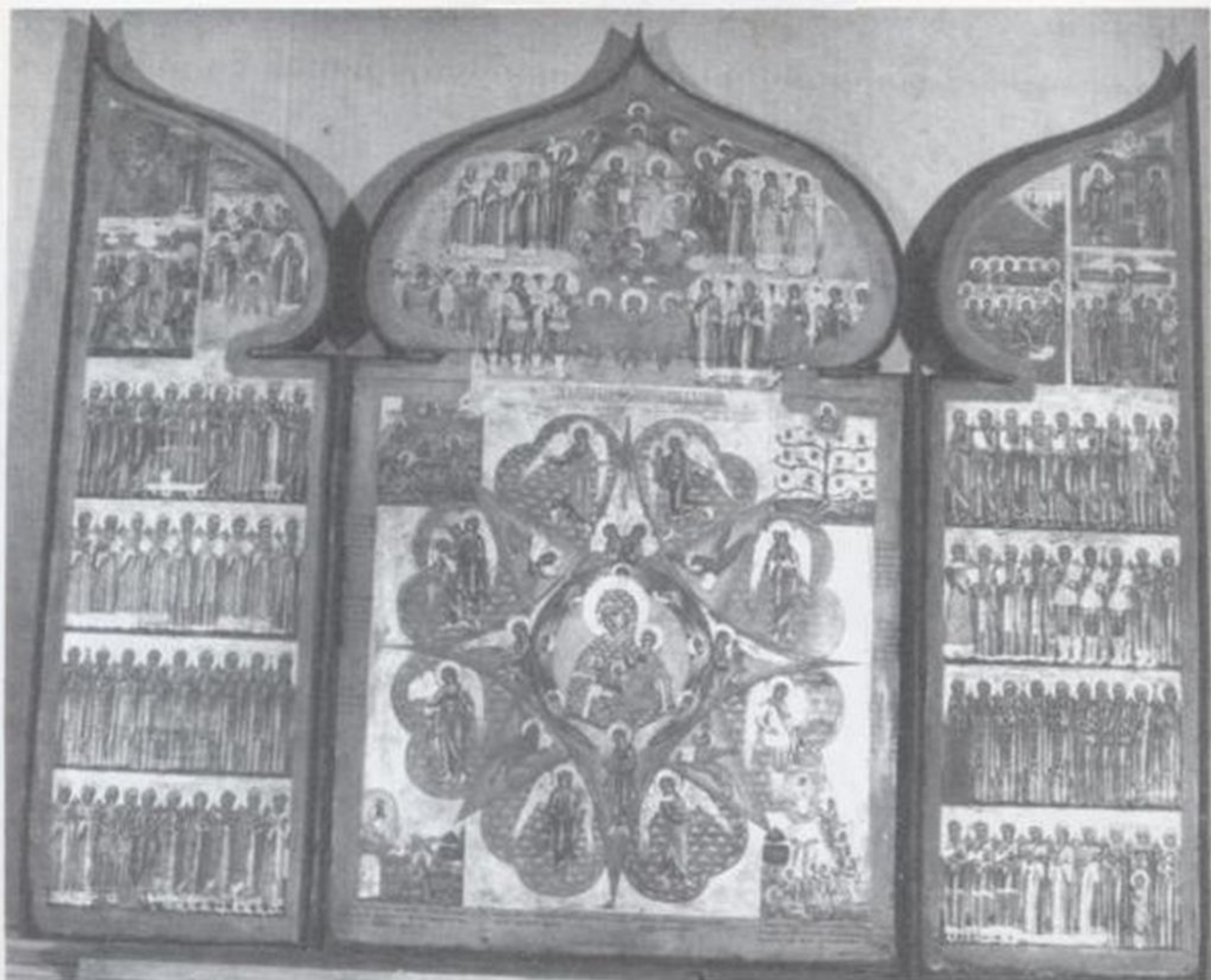
Складень трехстворчатый, 1764 г. Выг (?)