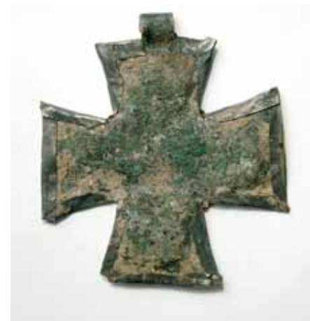
Крест наперсный. Обратная сторона.

Об этом событии рассказывает жизнеописатель св. Константина, Евсевий, его современник и собеседник. Оно случилось прежде обретения первоначального креста Христова равноапостольною