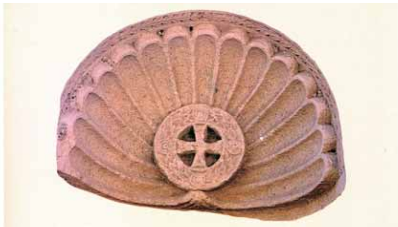
Фронтон ниши храма в Дандерах. IV в. Египет. Известняк.

Invictus) – государственному культу Римской империи со времени императора Аврелиана, – но и восприятию Солнца и Победы как божественных спутников-покровителей (comites) императора. Посвящения как «Непобедимому Солнцу» («Soli Invicto»), так и «Неизменной счастливой победе государя» («Victoriae laetae principis perpetuae»), обычные на монетах Константина, могут сочетаться с изображением креста, что соответствует восприятию креста как солярного символа. В свою очередь, в христианской традиции это определяет сочетание креста с надписью νικα . Например, на крестах, поставленных Константином на площадях, была надпись νικος 28 .