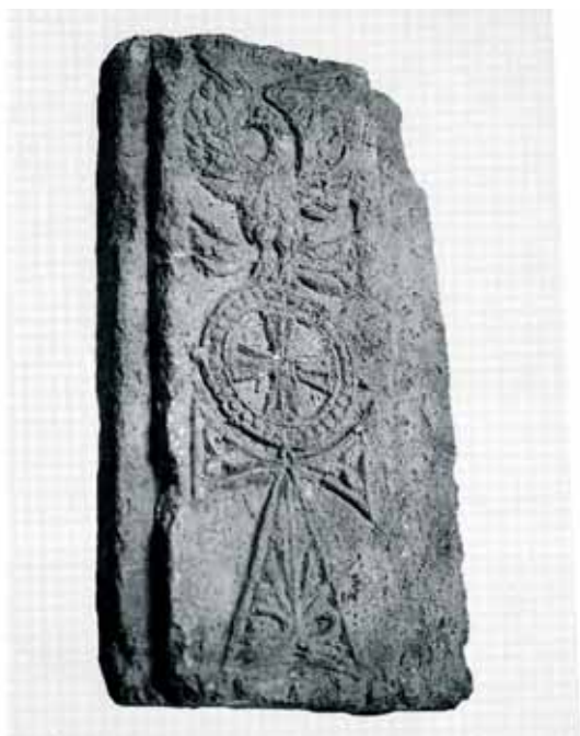
Капитель, украшенная рельефными изображениями крестов. VI в. Херсонес. Мрамор, резьба. В-21,0 см. Херсонесский гос. историко-археолог. музей-заповедник.

собрании Государственного Эрмитажа 34 . Такие же крупные кресты в венках вырезаны на стелах VI–VII вв. коптской работы 35 .