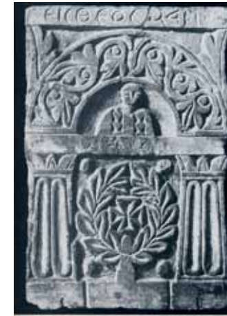
Стела в виде портала. VI–VII вв. Египет. Известняк, раскраска. 46,5×32,2×3,1 см. ГЭ.

Крест Христов издревле был знаменем последователей Иисуса Христа. Христиане получали знамение Христово при крещении и миропомазании, на что указывают слова при совершении этого таинства: «Печать дара Духа Святаго» 16 . Существует параллель между последователями Христовыми и воинами, на которую указывал св.