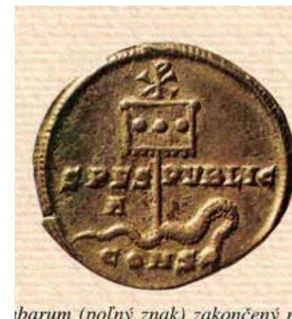
Монета царя Константина с изображением лабарума. IV в. Золото.