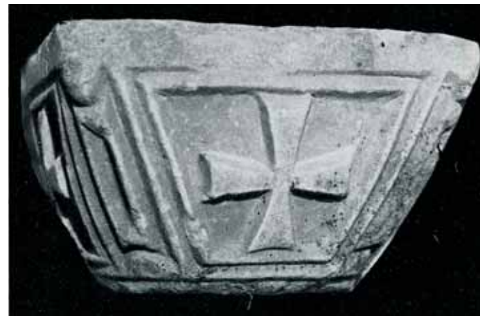
Плита с изображением креста в анхе. III–IV вв. Египет. Известняк, резьба. Музей коптского искусства в Каире.

Крест как знак победы стал необходимым атрибутом императора в Византии. Особая реликвия, так называемый Крест Константина, хранившийся в часовне св. Стефана в Большом императорском дворце в Константинополе был, по замечанию А.Н. Грабара, «неотделим от императора, как в дни мира, так и во время войны. Крест предшествовал ему в торжественных процессиях и сопровождал в битвах» 29 . Особое значение Победоносного Креста было связано не только с той ролью, какую он играл в битвах равноапостольного Константина как «предводитель» войска. Крест становится символом триумфа василевса, когда, приняв оружие победы Спасителя, император уподоблялся Христу. 30