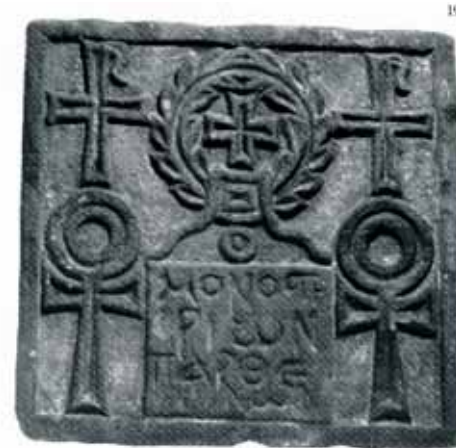
Плита с изображениями крестов и анхов. VI–VII вв. Египет. Известняк, резьба, раскраска. 35,5×34 см. ГЭ.

Г.А. Романов выделяет четыре основных мотива, повлиявших на формирование типа выносных крестов. Один из них – воспоминание победного креста императора Константина Великого, виденного им на небесах. По форме это крест, расширяющийся от средокрестия, как от источника света, во все четыре стороны, так называемый византийский или Константиновский крест. Тропарь Кресту «Спаси, Господи, люди Твоя...» связывают с посвящением св. императору Константину, которому Господь Крестом дарует победу. «Изгнание врагов, дарование победы, уподобление равноапостольному императору Константину Великому, – вот смысл применения константиновской формы креста в крестных ходах», – отмечает Г.А. Романов 23 . Константиновская форма запрестольных крестов признается исследователя-