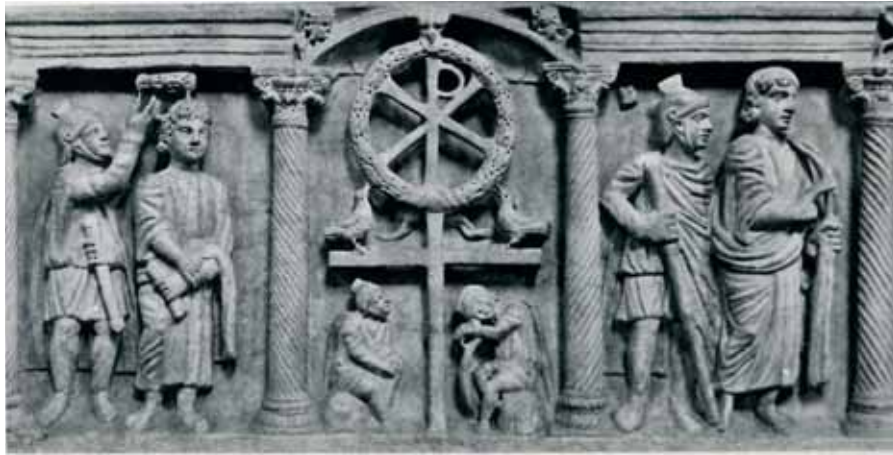
Саркофаг из Латеранского собора. IV век. Рим. Камень, резьба.

В настоящее время, как и во все времена после Константина, церковные хоругви с четвероконечным крестом служили и служат безмолвным наглядным памятником явления крестного знамения св. Константину на небе и устройства им воинского знамени с крестом, или лабарума. Настоящие хоругви имеют только то отличие от лабарума Константина, что на них, на самом верху, нет венца, а в нем – имени Христа Спасителя и что над поперечным реем, к которому привешивался священный плат и который с продольным древком составлял фигуру креста, у нас делается из верхушки продольного древка и маленького поперечника другой, очень небольшой крест. Но во всяком случае устройство четвероконечного креста на церковных хоругвях в соответствие собственно кресту, который хотел видеть в них св. Константин, должно быть предпочтительно устройству осьмиконечного: на небе ясно был изображен первый вид. Осьмиконечный крест, видимый иногда на хоругвях, есть уже русское изобретение: в Греции этого не было и нет теперь» 15 .