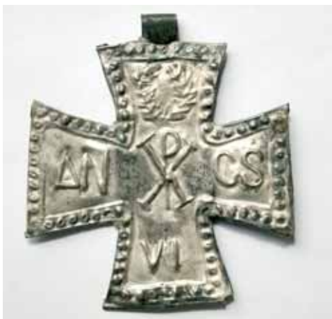
Крест наперсный. Найден в Крыму в 2005 г.

тину. Приведем отрывок из его книги: «Крест Христов, зарытый в землю по снятии с него животворящего тела Господа, был обретен и просиял, как солнце, чрез три века после того, при благочестивом царе Константине. Он был извлечен из земли св. царицею Еленою, матерью царя Константина, на украшение и славу всей Церкви. В это же время множество крестов и его изображений сделал Константин, который теперь в кресте полагал всю свою славу и, вместе с Апостолом, ничем не хвалился, как только крестом. В IV в. слава креста Христова наполнила все христианские жилища, разные домашние и военные уборы и даже места вне жилищ, так что св. Златоуст говорил уже: «крест находится везде в славе: на домах, на площади, в уединении, на дорогах, на горах, на холмах, на равнинах, на море, на корабельных мачтах, на островах, на ложах, на одеждах, на оружии, на пиршествах, на сосудах серебряных и золотых, на драгоценных камнях, на стенной живописи... так наперерыв все восхищают этот удивительный дар». Без сомнения, св. Златоуст говорит здесь о четвероконечном кресте, ибо другого вида креста тогда не было известно.