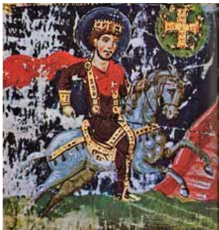
Миниатюра «Явление на небе креста царю Константину». Рукопись IX в. № 510, греческий фонд. Парижская Национальная библиотека.

мы помещались на щитах полководцев и императоров еще в эпоху Юстиниана Великого (527–565 гг.), известны они и на его монетах» 41 . «Об изображении победы (Виктории) с крестом на монетах римских императоров с самых древних времен – до Константина, – пишет св. Иоанн Кронштадтский, – равно как и при нём, весьма часто изображалась, между прочим, Виктория в образе крылатой человеческой фигуры. Ее представляли большею частью с лавровым венком в руке, который она или подает изображаемому подле нее императору, или возлагает на его голову, или просто держит его в своей руке, когда изображается одна. Это, очевидно, обычай языческий, который свидетельствовал о вере римских императоров и римского народа в богиню войны. Константин Великий первый дал этой мнимой богине в руки крест, и ее с этого времени последующие римские императоры начали изображать чаще и уже не с лавровым венком, а с истинным знаменем победы. Но Константин презирал самую богиню этого имени. На монетах последующих римских императоров, самых многочисленных и разнообразных, видна часто крылатая Виктория с крестом. Крест этот в руках победы, как видно из снимков монет, четвероконечный, – он состоит из длинной трости и небольшого поперечника. Константин первый ввел в обычай на монетах чеканить изображение креста и просто без победы» 42 .