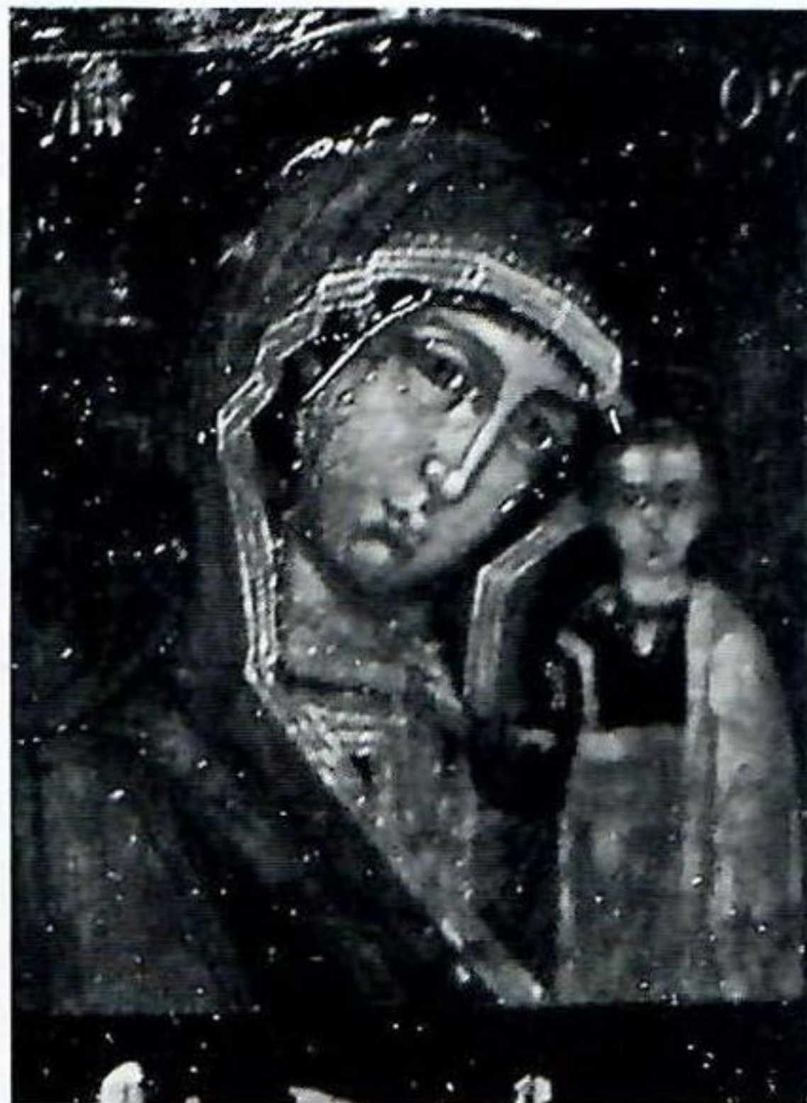
5. Казанская икона Богоматери («ватиканский» список) и ее оклад. Икона — первая половина — середина XVIII в. Оклад — конец XVIII — начало XIX в.

в 1579 г. в Казани. В 1950-е гг. он предлагал купить икону архиепископу Сан-Францисскому Иоанну (Шаховскому), но архиепископ Иоанн не в состоянии был принять это предложение. В 1962—1963 гг. икона хранилась в Сан-Франциско в специальном помещении банка. В Америке было распространено мнение, которого придерживался и владыка Иоанн, что это явленная в 1579 г. в Казани икона. В 1964 г. она выставлялась на Всемирной выставке в Нью-Йорке, представляя здесь Русскую Церковь. Образ был помещен в специальной часовне, выстроенной по модели первого православного храма в Америке конца XVIII в. в Форд-Росс в Калифорнии. В Америке был создан специальный комитет для сбора средств для постройки православного храма, где была бы помещена икона, однако, это предприятие не удалось. Был поддержан проект, предложенный католической организацией «Небесная (Голубая) Армия» ( Blue Army ), деятельность которой была связана с фатимскими явлениями Богоматери — икону покупает католическая организация, помещает икону в Фатиме