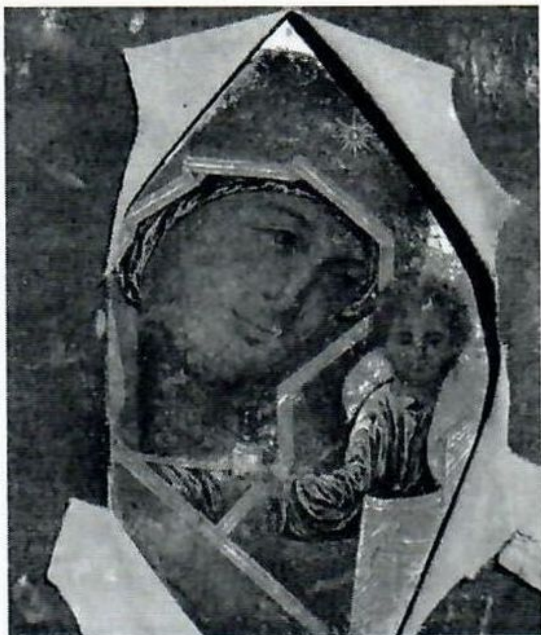
3. Казанская икона Богоматери. Вторая половина XVIII в. Без оклада. Церковь святых благоверных князей Феодора, Давида и Константина на Арском кладбище в Казани.