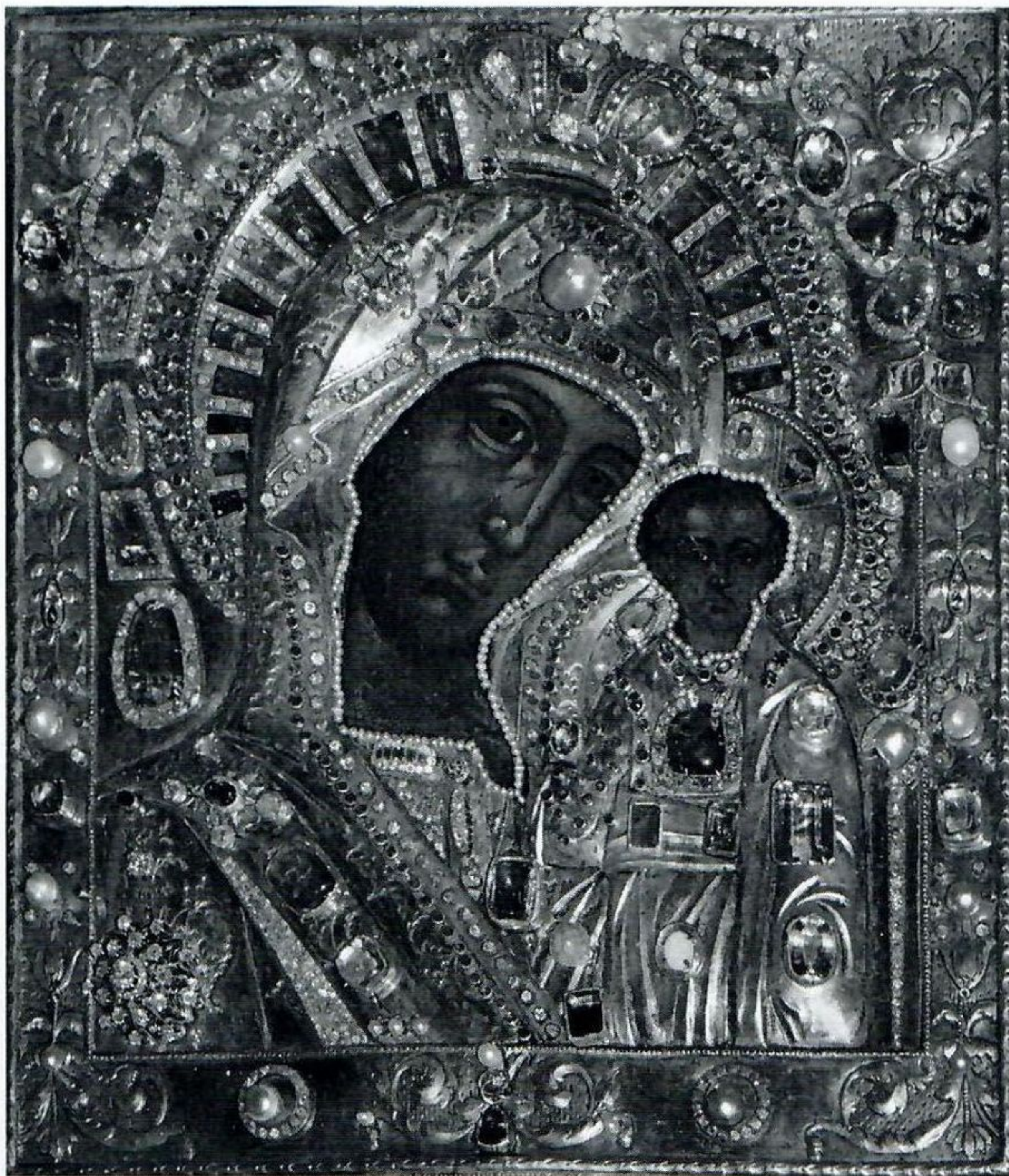
6. Казанская икона Богоматери («ватиканский» список). Первая половина — середина XVIII века. Оклад — конец XVIII — начало XIX века. Крестовоздвиженская церковь Богородицкого Казанского монастыря в Казани.