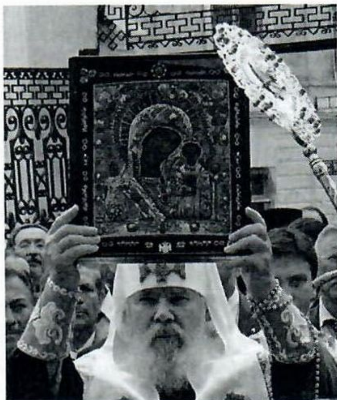
4. Патриарх Московский и всея Руси Алексий II благословляет Казанской иконой («ватиканским» списком) в Богородицком Казанском монастыре. Фото 2005 г.

си середины — второй половины XVI столетия. Казанская икона особенно интересна именно тем, что она представляет новаторский для древнерусского искусства иконографический извод, характеризующий переход от древнерусских традиций к искусству Нового времени.